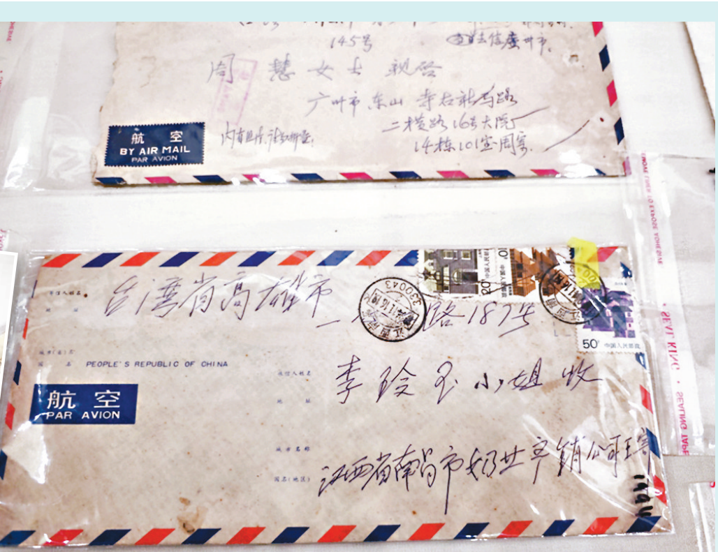
◀◀現場展示的部分書信。