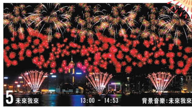
第五幕「未來我來」 「銀柳帶彩千輪星彩色小花」及「彩色千輪紅牡丹」美麗多變的造型煙花大放異彩，火樹銀花，寓意前路充滿希望