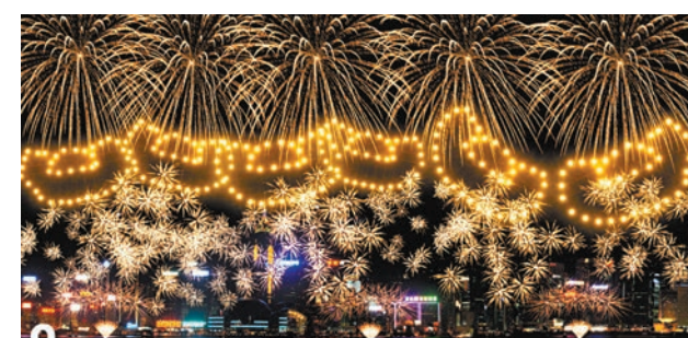
第八幕「豐收鑼鼓」 伴隨《豐收鑼鼓》的悠揚樂聲，甲辰龍年煙花匯演進入高潮，綻放「金元寶」及「千輪金雨」造型煙花。「特大錦冠」造型煙花最後30秒密集式發放，將熱烈氣氛推至最高點