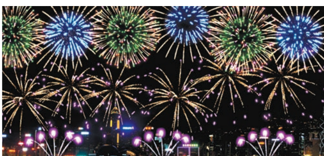
第四幕「家在香港」 「紫鐵樹帶錦尾」寓意為香港帶來吉祥富貴，緊接着「金變菊帶錦尾」以及「藍向日葵帶藍閃閃」造型煙花閃耀夜空，象徵着香港是一個多元文化交融的社會