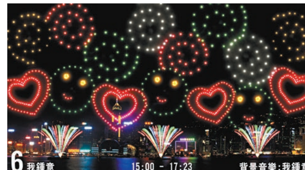
第六幕「我鍾意」 「彩色變幻球螺旋」在夜空中升起，接着呈現最有愛的「笑臉」及「雙紅心」造型煙花，享受香港繁華都市的各種樂趣