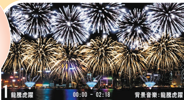
第一幕「龍騰虎躍」 一片響亮的鑼鼓聲為煙花匯演展開序幕。「龍蛋大金棕櫚」在空中盤旋翻滾，寓意孕育一代又一代優秀龍的傳人