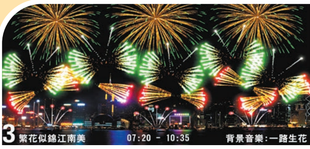
第三幕「繁花似錦江南美」 「魔法牡丹變時雨銀星尾」造型煙花在空中閃耀，「變色蝴蝶」及「金波變紅蝴蝶」循着煙花的光跡，祝願香港一路生花，華麗前行