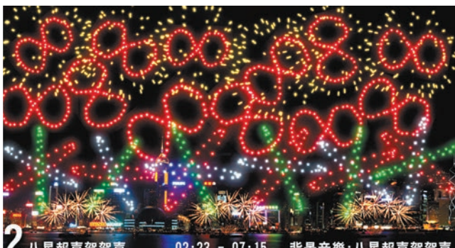
第二幕「八星報喜賀賀喜」 「金色8字」及「紅色8字變爆裂」的造型禮花彈，寓意財源滾滾，「五彩乾坤球」祝賀市民時來運轉，前途無限