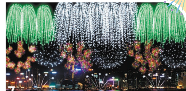
第七幕「You Raise Me Up」 「銀線瀑布」以及「綠閃瀑布」造型煙花從天空傾瀉而下，隨後緊接着「橙閃」、「銀閃」以及「千輪彩閃」造型煙花，寓意愛的光芒會繼續照亮人生更多可能