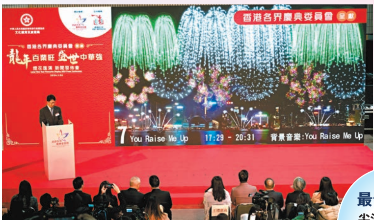
◆主辦方介紹農曆新年煙花匯演詳情及各項安排。