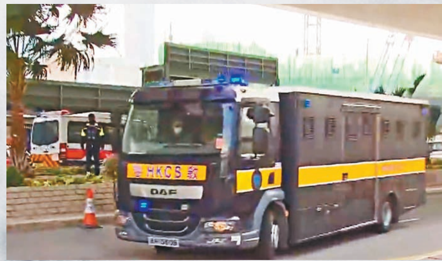
◆黎智英昨日被押解到西九龍法院。