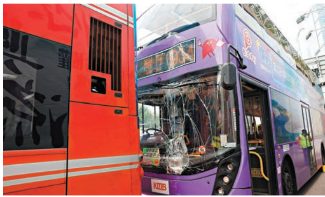
西隧九龍入口兩九巴首尾相撞，後車車頭擋風玻璃破裂。

事發後，多輛救護車抵至救援，經醫護人員在場檢查乘客傷勢，據悉，兩車分別有5人及9人受傷，經包紮及分流後，有4男7女(40歲至80歲)被分別送往廣華醫院及伊利沙伯醫院進一步治理。一名934線的受傷女乘客指，當時巴士急煞及猛力撞擊