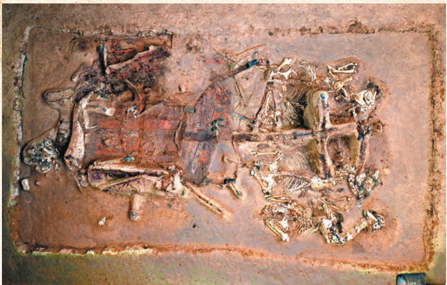
◆秦始皇陵一號陪葬墓P2陪葬坑出土四馬獨轆木車一輛，馬骨保存基本完整，均佩戴馬勒等馬具，處於駕車狀態。

香港文匯報訊（記者 李陽波 西安報道）帶有完整方形彩繪車蓋的四輪獨轆木車、六羊並駕若正在行駛中的羊車……秦始皇陵博物院1月26日公布秦始皇陵一號陪葬墓最新考古收穫，在歷時多年的考古發掘中，出土了八輛多種形式、多種形制和多種用途的車輛。特別是該墓北墓道清理出的帶有完整方形彩繪車蓋且遺蹟保存完整的四輪獨轆木車，是目前考古所發現的唯一一輛埋藏於墓中的四輪車實物。據初步判斷，可能是下葬時運輸棺柩的載柩車，屬於一種非常少見的喪葬現象。