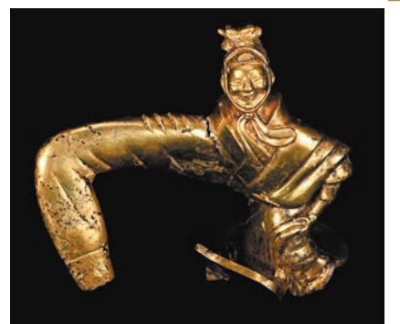
◆秦始皇陵一號陪葬墓出土的金舞袖俑。香港文匯報陝西傳真