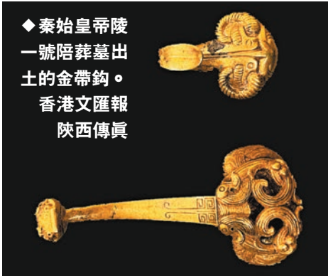
◆秦始皇陵一號陪葬墓出土的金帶鈎。