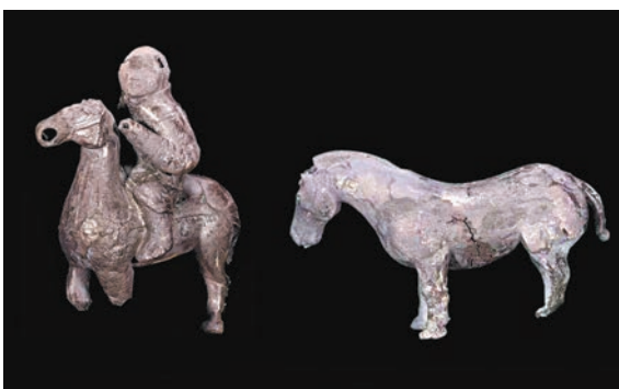
◆秦始皇陵一號陪葬墓出土的騎馬俑和馬俑等小型俑。