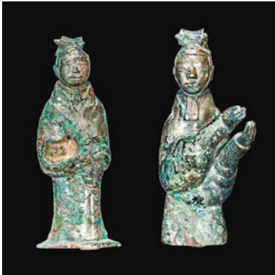
◆秦始皇陵一號陪葬墓出土的小型吹奏俑和百戲俑。香港文匯報陝西傳真