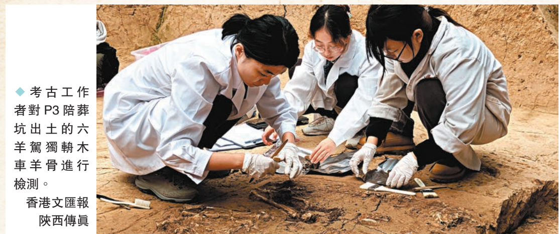
◆考古工作者對P3陪葬坑出土的六羊獨轆木車羊骨進行檢測。

位於陝西西安臨潼的秦始皇陵，是中國古代規模最大、結構最複雜、埋藏最豐富的帝王陵墓。目前在陵區已出土陶俑、陶馬、銅車馬、石鑿甲，以及青銅水禽和兵器等在內的珍貴文物五萬餘件。其中三個兵馬俑陪葬坑成「品」字形排列，坑內排列着大約6,000多件兵馬俑。從2011年開始，秦始皇陵博物院對秦陵外城西側展開詳細的考古勘探工作，發現東西一字排列的九座大中型墓葬。從2013年開始，考古工作者對其中呈「中」字形的一號陪葬墓進行了持續發掘。