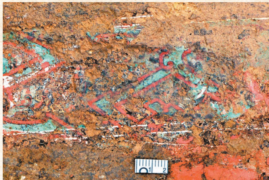
◆秦始皇陵一號陪葬墓P2陪葬坑出土的彩繪遺蹟。香港文匯報陝西傳真