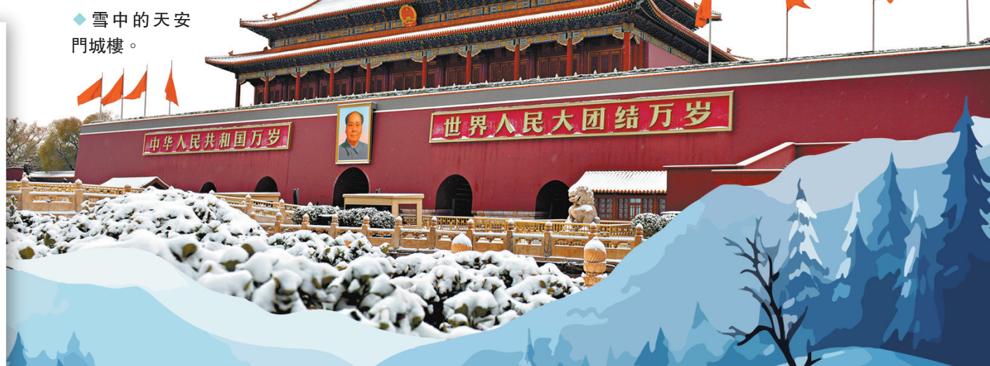
◆雪中的天安門城樓。