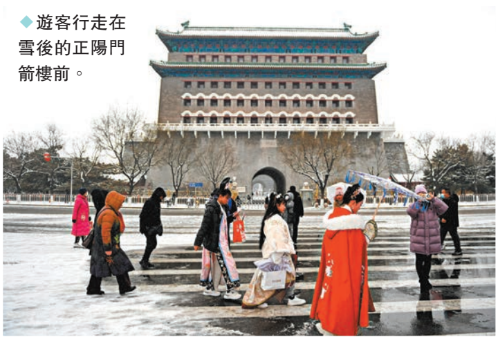
◆遊客行走在雪後的正陽門箭樓前。