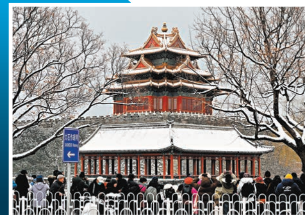
◆遊客冒雪在故宮角樓前拍攝。