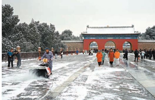
◆工作人員在天壇公園丹陛橋上清理冰雪。