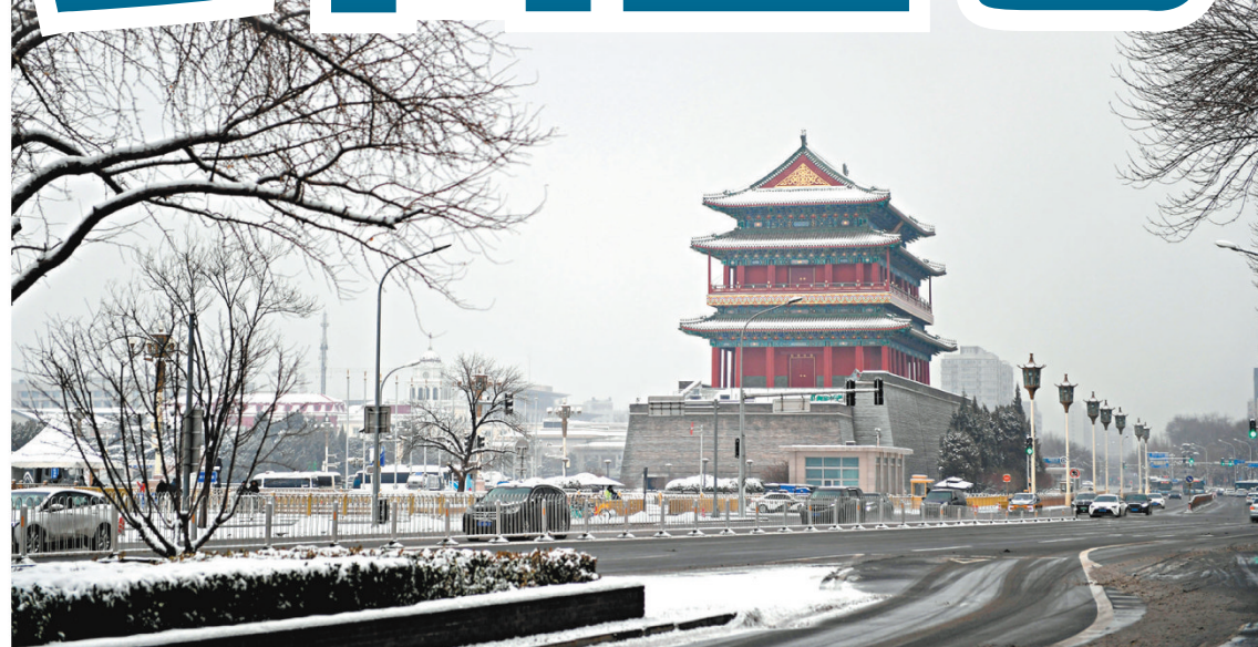
◆雪中正陽門城樓像往常一樣望着車來車往。

雪後的天安門廣場，五星紅旗在風中飄揚，為冬日添上暖意。更有穿着鮮紅外衣的遊客在廣場與天安門合照。這一刻，腳下雖是冰雪，但心中溫潤潮生。