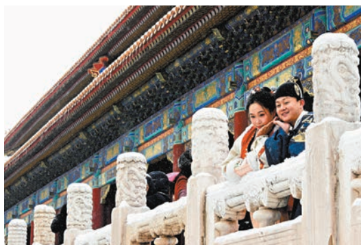
◆遊客在雪中故宮拍攝古裝照。

向着中軸線的南端走，你便能來到建於1420年的天壇。這是明清皇帝祭祀上天的場所，也是世界上現存規模最大、保存最完整的古代祭天建築群。祈年殿又稱祈谷殿，是天壇的主體建築。現在的季節，積雪覆蓋了祈年殿的藍瓦紅柱，讓整個大殿多了份靜謐。而在天壇公園和其他中軸線上的景區中，一切盡情玩樂的背後，都有工作人員的守護。他們推着清雪機，為大家開出條條大路。