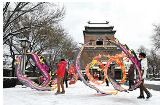
◆市民在北京鐘樓前舞龍。