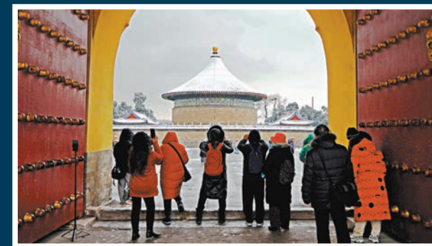
◆遊客在天壇公園拍攝雪景。