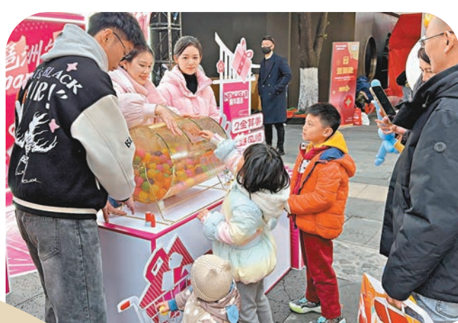
◆闔家參與新春趣味遊戲。

香港車主吳女士表示，今年也將迎來「港車北上」春節首秀，拓展了港人北上過年的半徑。有了自己的「車尾箱」，無論是北上出遊還是採購年貨都更方便。「『港車北上』讓港人更便捷地去體驗灣區各地不一樣特色的年味，過一個跟往年都不一樣的新年。」