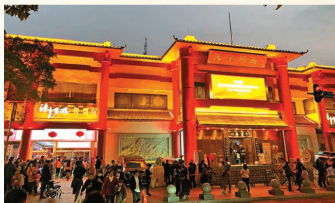
◆珠江夜遊天字碼頭。