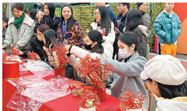
◆在新春手工藝中尋「年味」。