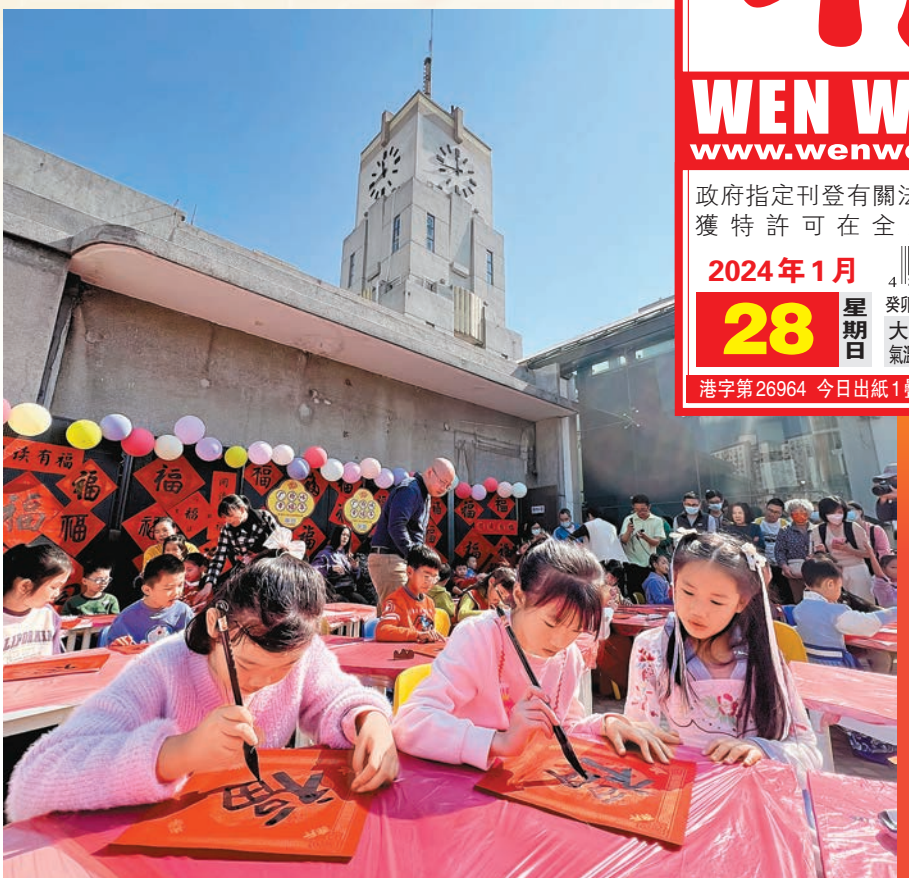
◆2024年「廣府味 幸福年」廣府文化系列活動舉行。圖為青少年揮毫寫「福」。