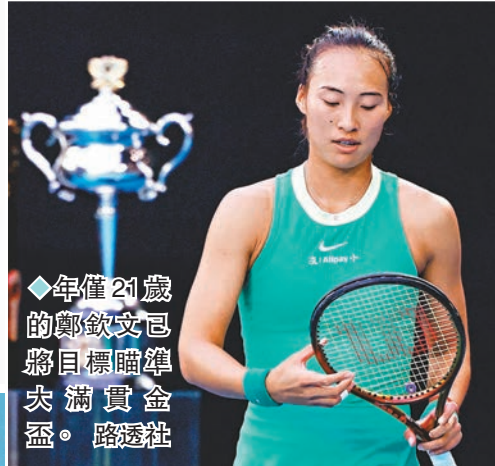
◆年僅21歲的鄭欽文已將目標瞄準大滿貫金盃。