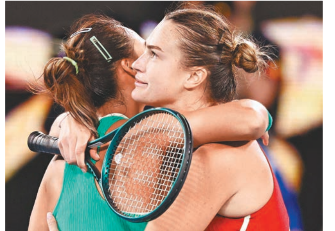
◆冠軍薩芭蘭卡(右)賽後與鄭欽文相擁，惺惺相惜。