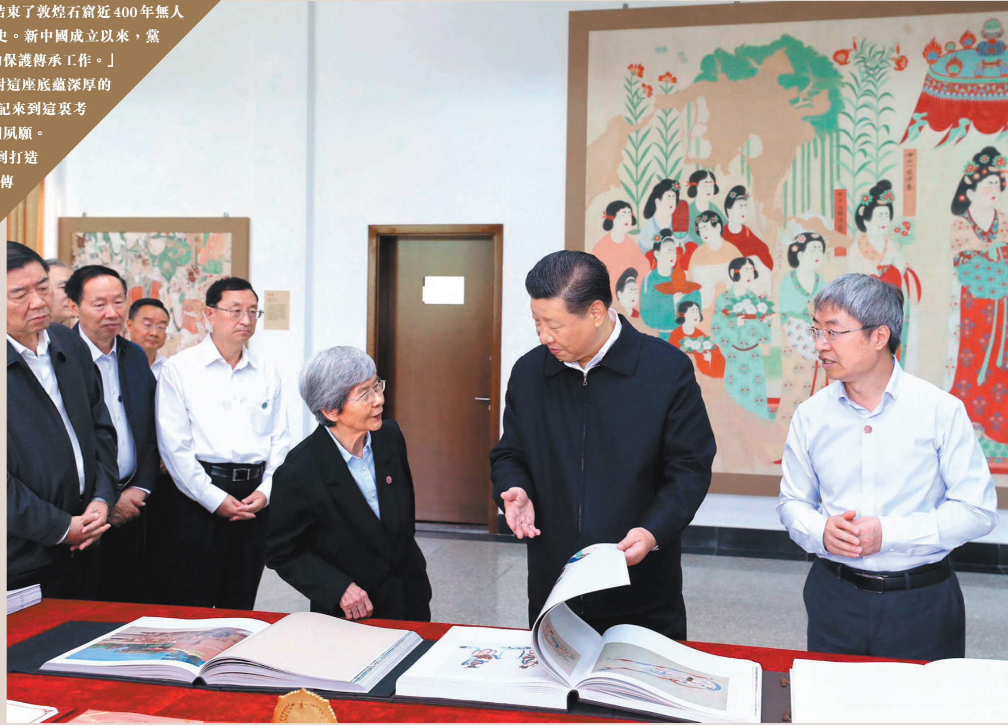
●2019年8月19日，習近平來到敦煌研究院，察看珍藏文物和學術成果展示，並同有關專家、學者和文化單位代表座談。