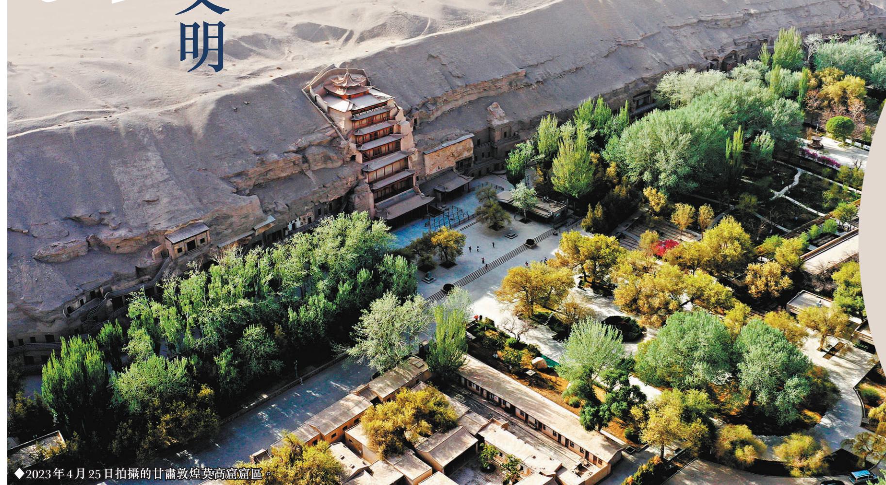
◆2023年4月25日拍攝的甘肅敦煌莫高窟窟區。

甘肅蘭州，讀者出版集團有限公司。一樓中廳展廳上，2022年推出的《甘肅藏敦煌文獻圖錄》格外醒目。 2019年8月21日下午，習近平總書記來到讀者出版集團有限公司考察調研。在這裏，總書記再次提及了敦煌。 副總經理康年回憶說：「習近平總書記提到，敦煌文獻涉及方方面面，是豐富的歷史資料。這幾年，我們積極貫徹落實總書記的要求，出版了一大批與敦煌、簡牘相關的圖書。」 國家強盛才能文化繁榮 敦煌藏經洞，記錄著一段「吾國學術之傷心史」。 1900年，藏經洞被發現。彼時國力衰微，無數珍貴文物流失海外。 在莫高窟藏經洞參觀時，習近平總書記主動講到王圓箴道士發現藏經洞的經過。 撫今追昔，習近平總書記指出：「國家強盛才能文化繁榮。」 2023年4月，「數字藏經洞」上線，數字孿生技術復原了洞窟實體與所藏文物。動動手，用戶便可扮演不同角色，「穿越」 至晚唐、北宋、清末等時期，與洪昇高僧等歷史人物進行互動，感受洞窟營造、放置經書等不同場景，沉浸式體驗敦煌文化。 「實現敦煌文化藝術資源在全球範圍內的數字化共享」——在習近平總書記的勉勵下，「數字敦煌」進一步躍升，正變成現實。 敦煌，中國通向西域的重要門戶。古代中國文明同來自古印度、古希臘、古波斯等不同國家和地區的思想、宗教、藝術、文化在此匯聚交融。 使者張騫鑿空西域，薩埵太子捨身飼虎、反彈琵琶樂舞千年……歷史長河奔湧，莫高窟數百個洞窟中栩栩如生的壁畫上，留下了文明交流互鑒的鮮明印記。 心懷自信才能屹立不倒 「中華文明的包容性，從根本上決定了中華民族交往交流交融的歷史取向，決定了中國各宗教信仰多元並存的和諧格局，決定了中華文化對世界文明兼收並蓄的開放胸懷。」在文化傳承發展座談會上，習近平總書記話語鏗鏘。 只有充滿自信的文明，才會在保持自己民族特色的同時包容、借鑒、吸收各種不同文明；只有心懷自信的民族，才能在歷史潮流激盪中屹立不倒，飽經磨難而生生不息。敦煌，正是這一歷史進程的不朽見證。 帶著這樣的包容與自信，敦煌以開放的姿態走向未