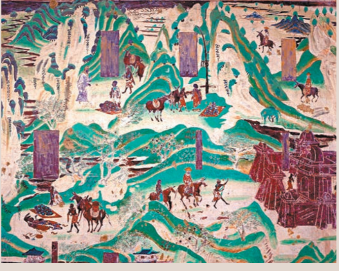
▲莫高窟第217窟的青綠山水壁畫。