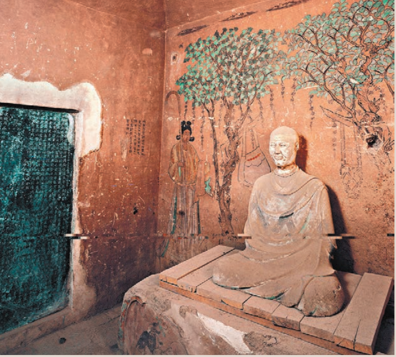
▲莫高窟第17窟藏經洞。