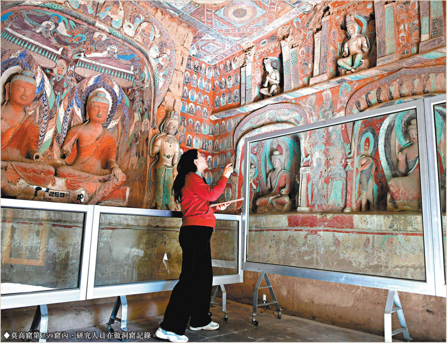
◆莫高窟第259窟內，研究人員在做洞窟記錄。

時任敦煌研究院院長趙聲良告訴總書記，這幅壁畫摹本取材於莫高窟第217窟，講述印度高僧佛陀波利兩次來五台山禮佛的故事。這幅青綠山水畫，體現着中國傳統的審美精神。 今天，兩晉南北朝至隋唐的畫作絕大多數已經失傳。這種色彩明快的唐代青綠山水畫，是莫高窟為後世留存的一段珍貴文化記憶。 「如果不從源遠流長的歷史連續性來認識中國，就不可能理解古代中國，也不可能理解現代中國，更不可能理解未來中國。」在2023年6月召開的文化傳承發展座談會上，習近平總書記道出了他珍視文脈的原因所在。 建設中華民族現代文明 來到福建武夷山朱熹園，強調「我們要特別重視挖掘中華五千年文明中的精華」；在四川眉山三蘇祠，感嘆「一個三蘇祠可以看出我們中華文化的博大精深」；走進河湟安陽殷墟遺址，指出「中華文明源遠流長，從未中斷，塑造了我們偉大的民族，這個民族還會偉大下去的」…… 一切國家和民族的崛起，都以文化創新和文明進步為先導和基礎。 敦煌情，是習近平總書記文化情懷的生動寫照，更是面向未來的深謀遠慮—— 「只有全面深入了解中華文明的歷史，才能更有效地推動中華優秀傳統文化創造性轉化、創新性發展，更有力地推進中國特色社會主義文化建設，建設中華民族現代文明。」