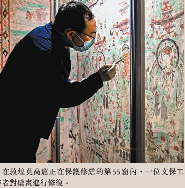
▲在敦煌莫高窟正在保護修繕的第53窟內，一位文保工作者對壁畫進行修復。