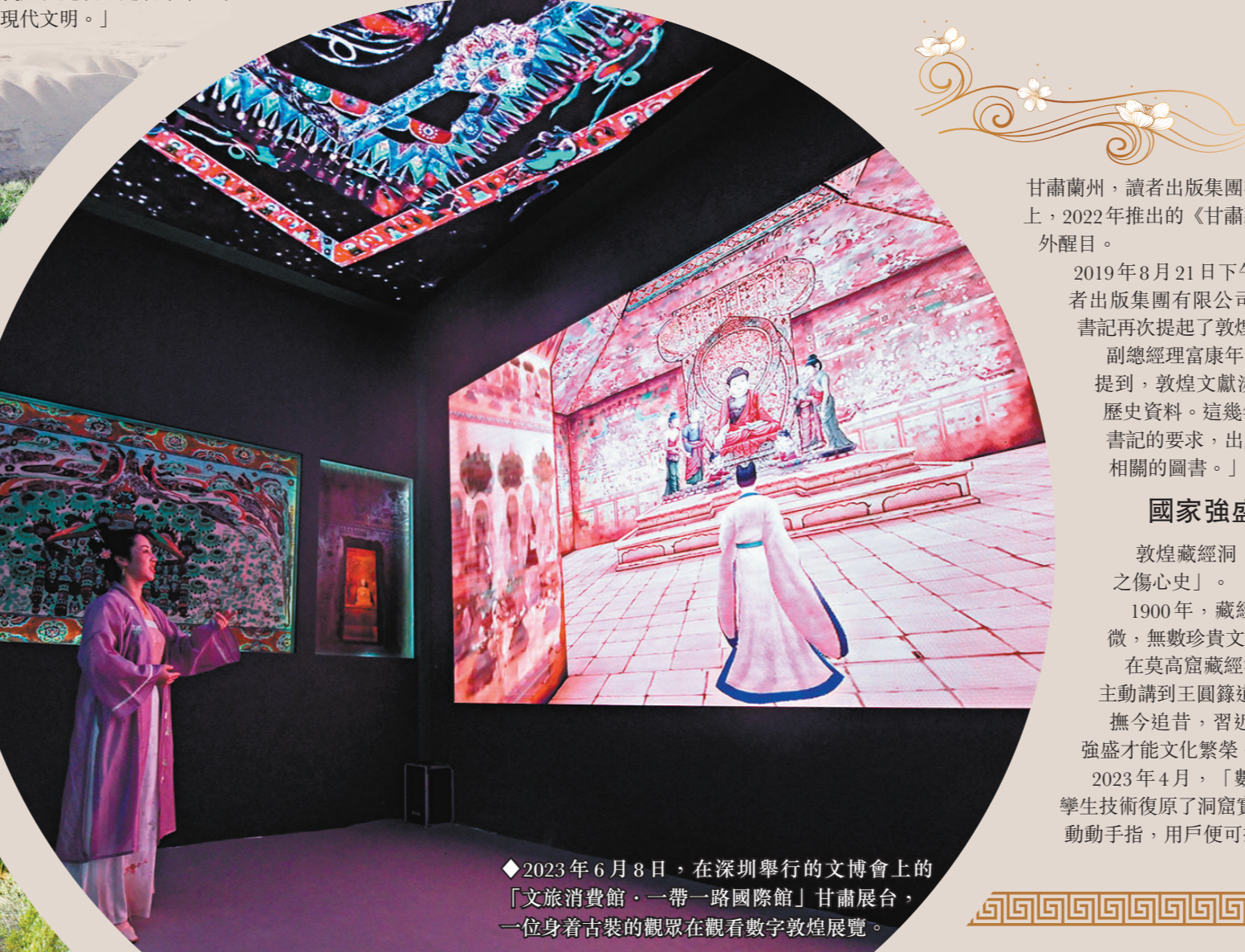
◆2023年6月8日，在深圳舉行的文博會上的「文旅消費展·一帶一路國際館」甘肅展台，一位身著古裝的觀眾在觀看數字敦煌展覽。