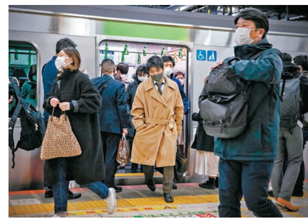
◆ 日本新冠病例續增，專家指已爆發第10波疫情。

菅谷根據海外報告指出，相信國內死亡病例數不會因 JN.1 擴散而快速增加，但強調仍有一定程度的重症化風險，特別是高齡人士須多加留意。菅谷還說，儘管流感看似已過流行高峰，但目前仍在流行，希望民眾持續確實做好戴口罩及勤洗手等防疫對策。