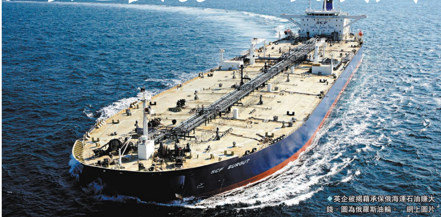
◆ 英企被揭藉承保俄海運石油賺大錢。圖為俄羅斯油輪。

報道指出，英國一邊大力制裁俄羅斯，一邊卻捨不得放棄這賺錢機會。CREA 也在報告中分析稱，俄羅斯依賴英國承保石油運輸，讓英國可實施更好的監控和執行力度，以大大降低俄羅斯的石油出口收入，但實際卻未有這樣做，直言「這在一定程度上也表明，英國向烏克蘭提供的支持和援助有點故作姿態」。