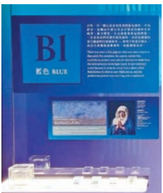
◆古時藍色顏料較黃金更貴重（香港故宮展覽）。

對於油畫顏料的歷史，我們在香港很少機會了解到，正在香港故宮文化博物館舉行的「從波提切利到梵高：英國國家美術館珍藏展」就有介紹不同顏料以往所含的物質，十分珍貴，展期至4月1日。