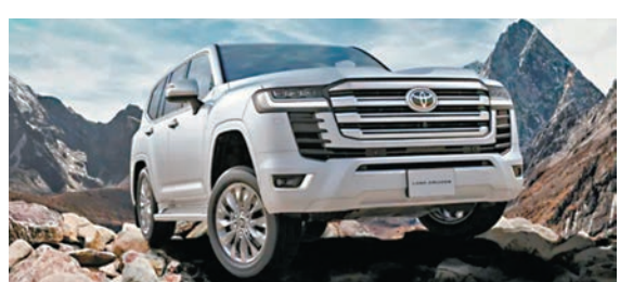
◆Land Cruiser 300是豐田暫停出貨的其中一款車輛。

客、零售店與供應商等致歉，表示將非常嚴肅地對待該事件並深刻反省。伊藤浩一指出，違法原因是「與豐田汽車的溝通不足」，並欠缺遵守法令的意識。日本國土交通省周二上午會進入豐田織機位於愛知縣碧南市的工廠進行調查。