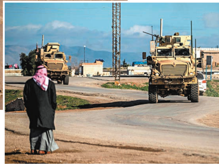
▶ 美軍裝甲車在敘利亞東北部地區加強巡邏。