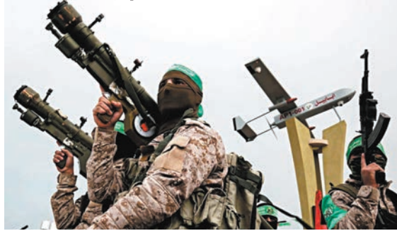
◆哈馬斯部分武器被指源自以軍。

香港文匯報訊 《紐約時報》周日（1月28日）報道，根據以色列軍方和情報官員得出的結論，巴勒斯坦武裝組織哈馬斯在新一輪巴以衝突中使用的大量武器裝備，實際上來自以色列軍方。