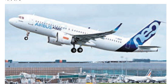
◆聯合航空傳洽購空巴A320neo客機。網上圖片

波音曾表示，希望今年6月前獲得批准交付MAX 10。聯航已訂購277架MAX 10，是這最大型MAX機的最大買家。柯比在上周舉行的聯航業績匯報會上沒提及取消相關訂單，但認為波音可能無法履行合約規定，如期交付這新款新機。