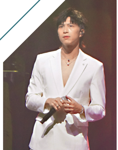
◆坤哥脫下眼鏡化身白馬王子。