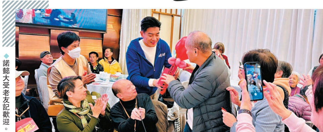
◆諾懿大受老友記歡迎。

Credits 場地提供：BRACES AND FACES 髮型師：WiiTam @artifyLab 指甲眼睫毛：@21March_nailslashes 服裝：Chanel