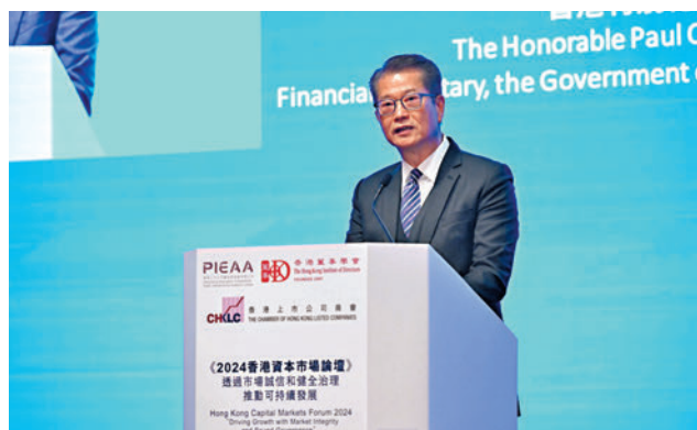
◆陳茂波指，香港要加深與內地金融市場互聯互通，貢獻國家建設金融強國。

他坦言，地緣政治難免影響了部分來自歐美的資金流向，但同樣因為全球政治格局的形勢，中東的資金，從主權基金到家族辦公室，也在積極尋求歐美以外的投資機會。中東的主權基金截至2022年底的資產總規模達到