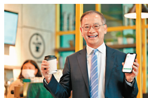
◆香港金管局總裁余偉文在曼谷一家咖啡廳使用了轉數快×PromptPay跨境二維碼支付互聯。