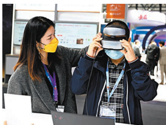
◆市場監管總局表示要加強產業鏈全面質量管理。圖為早前,參觀者在2022世界集成電路大會上參觀體驗。 資料圖片

另外,穩步擴大標準制度型開放,構建更加開放的標準化工作體系,積極參與國際標準組織治理等。