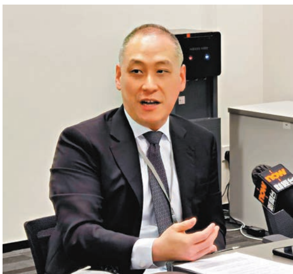
◆立法會金融服務界議員李惟宏。