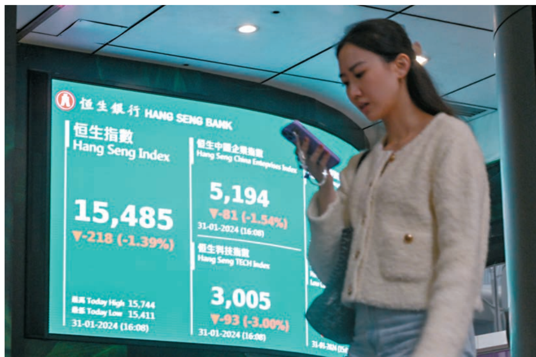
◆恒指昨日跌1.39%，專家指2月表現或繼續疲弱。