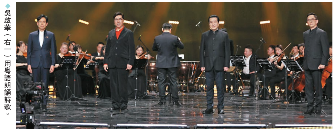
吳啟華（右二）用粵語朗誦詩歌。