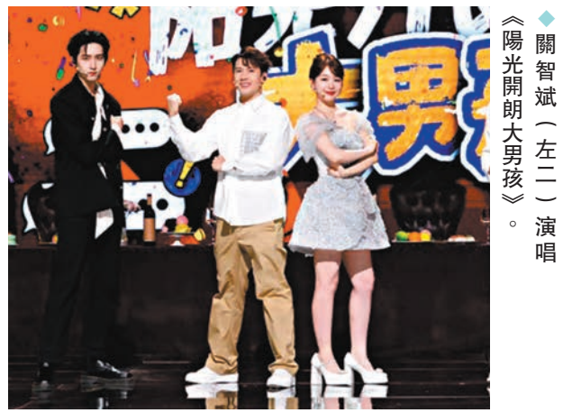
關智斌（左二）演唱《陽光開朗大男孩》。