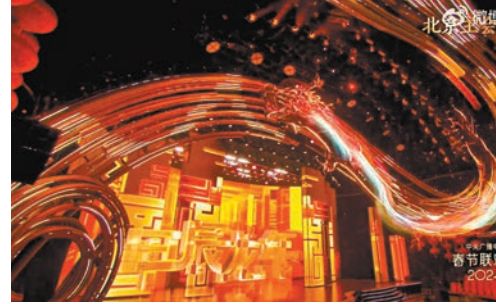
龍形舞美裝置生動演繹出「飛龍在天」的翱翔之姿。