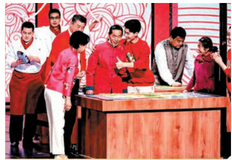
央視春晚於細微處凸顯百姓對幸福生活的追求。