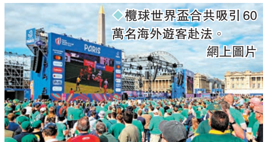
◆欖球世界盃共吸引60萬名海外遊客赴法。網上圖片

授查德威克稱，統計顯示全球130多個國家和地區，現時近900萬人會定期參加欖球比賽，伴隨該項目逐步發展，吸引投資的契機將愈來愈多，「我們相信未來10到20年間，欖球的商業吸引力將發生巨大變化。」