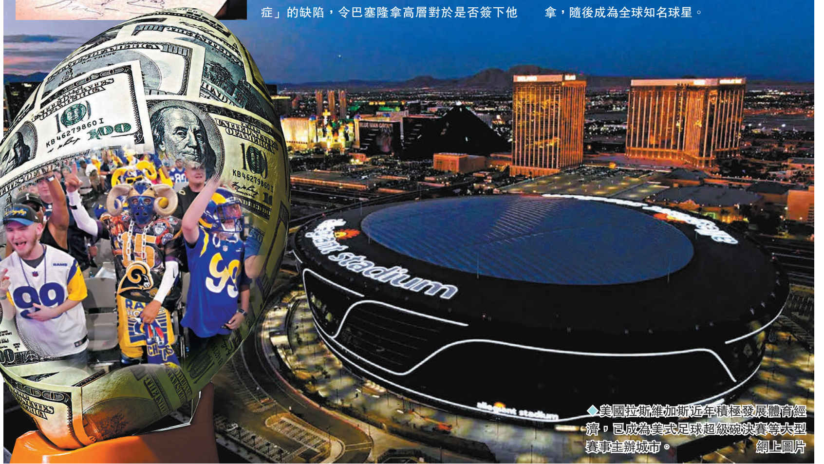
◆美國拉斯維加斯近年積極發展體育經濟，已成為美式足球超級碗決賽等大型賽事主辦城市。網上圖片

這張餐巾紙合約的日期是2000年12月14日，上面寫着，在顧問和經理人見證下，列薩治履行職權，無論有任何反對意見，只要遵守商定金額，就和美斯簽約，但餐巾紙上沒有美斯本人簽名。一個月後，美斯正式加盟巴塞隆納，隨後成為全球知名球星。