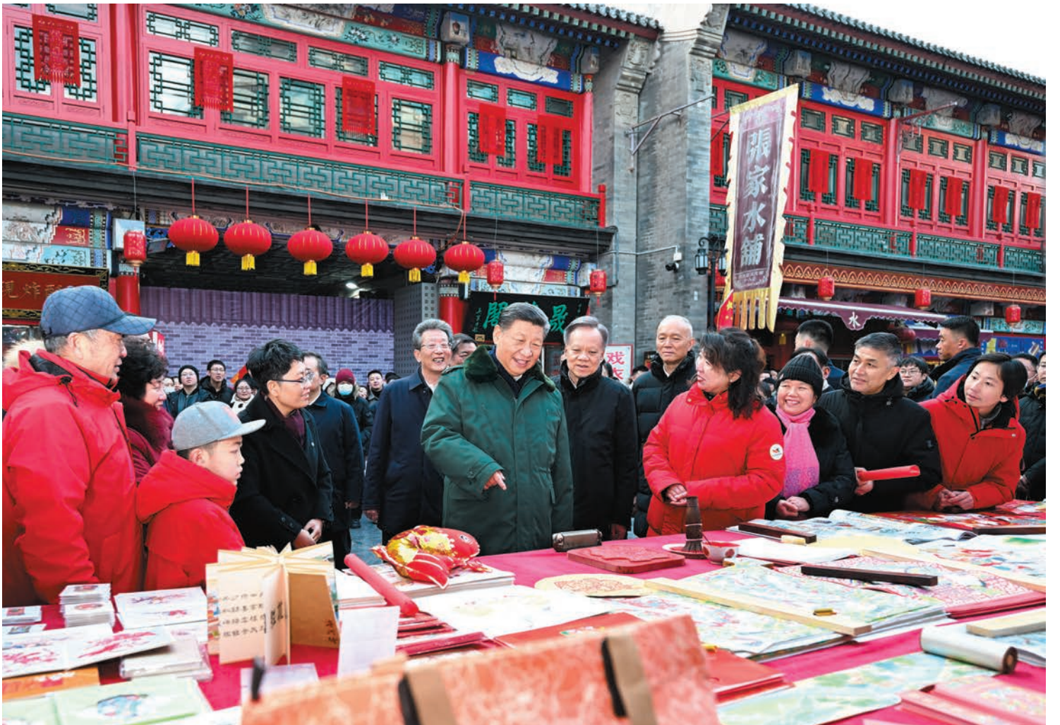
▶2月1日下午，習近平在天津古文化街考察時，同店舖員工和現場群眾互動交流。

2月1日至2日，習近平在中共中央政治局委員、天津市委書記陳敏爾和市長張工陪同下，深入農村、歷史文化街區、革命紀念館考察調研，給基層幹部群眾送去黨中央的關懷和祝福。