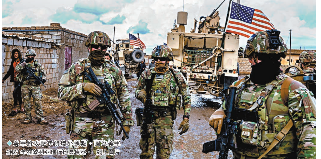
◆美軍將攻擊伊朗境外據點。圖為美軍2021年在敘利亞進行地區偵察。

拉法是加沙最南端的城鎮，巴以衝突爆發以來，加沙約220萬人口已有85%流離失所。在湧入約100萬難民的拉法，當地庇護設施已人滿為患，人道物資極為短缺。以軍攻勢則節節向南推進，巴人難民無處可逃，多數集中在拉法。