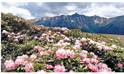
◆ 白馬雪山高山杜鵑。

白馬雪山高山杜鵑林的美是一種無法抵抗的美，有人甚至形容是令人窒息的美。春季或春夏之交是白馬雪山杜鵑花開季節，漫山遍野的杜鵑，有密枝杜鵑、金背杜鵑、銀背杜鵑、韋化杜鵑、小葉杜鵑……各種不同的杜鵑，各種不同的情態交織渾然一體。奇特的美，各種不同的情態交織渾然一體。