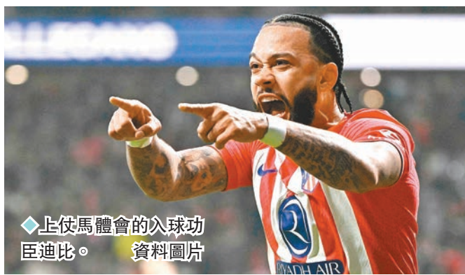
◆上仗馬體會的入球功臣迪比。資料圖片

香港文匯報訊（記者 梁志達）西班牙首都打吡將是一個月內第三度上演，之前兩項盃賽各贏一次的皇家馬德里與馬德里體育會，此戰西甲聯賽隨時再演「入球騷」。(now632台周一4:00a.m.直播) 皇馬上月西班牙超級盃準決賽加時大勝馬體會5:3，一周後在西班牙盃卻被馬體會加時以4:2擊退。而在西班牙