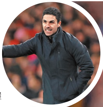
▲阿仙奴主帥阿迪達對上8次與利物浦交手，只贏了1次。資料圖片