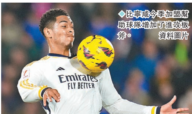
◆比寧咸今季加盟幫助球隊增加了進攻板斧。