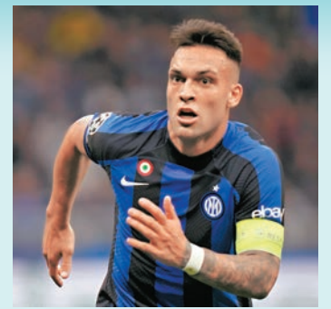
◆拿達路馬天尼斯成了對手防線的噩夢。資料圖片

香港文匯報訊（記者 梁志達）國際米蘭與祖雲達斯將會爆發意甲榜首大戰，雙方可說勢均力敵，然而相信始終是以國米士氣略優。(now638台周一3:45a.m.直播)