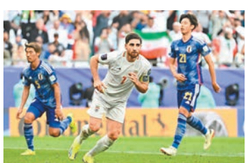
◆伊朗中場查漢巴克殊(中)慶祝入球。

香港文匯報訊（記者 梁志達）在卡塔爾舉行的亞洲盃足球賽八強戰，上屆殿軍日本隊昨日在上半場先拔頭籌下，換邊後連失兩球，最終以1:2遭伊朗逆轉，無緣晉級。而在較早時間上演的比賽，韓國隊在補時由黃喜燦射入12碼「絕平」對手後，加時由孫興民入球救主，反勝澳洲隊2:1出線四強。對於連續兩場後上逼對手入加時最終逆轉獲勝，韓國隊球星孫興民承認連場踢120分鐘十分不容易，然而球員展現出了團隊精神，「我可以自信地說，我們的力量在於我們團結在一起。」約旦隊小勝塔吉克斯坦隊1:0，隊史首次入圍亞洲盃四強。