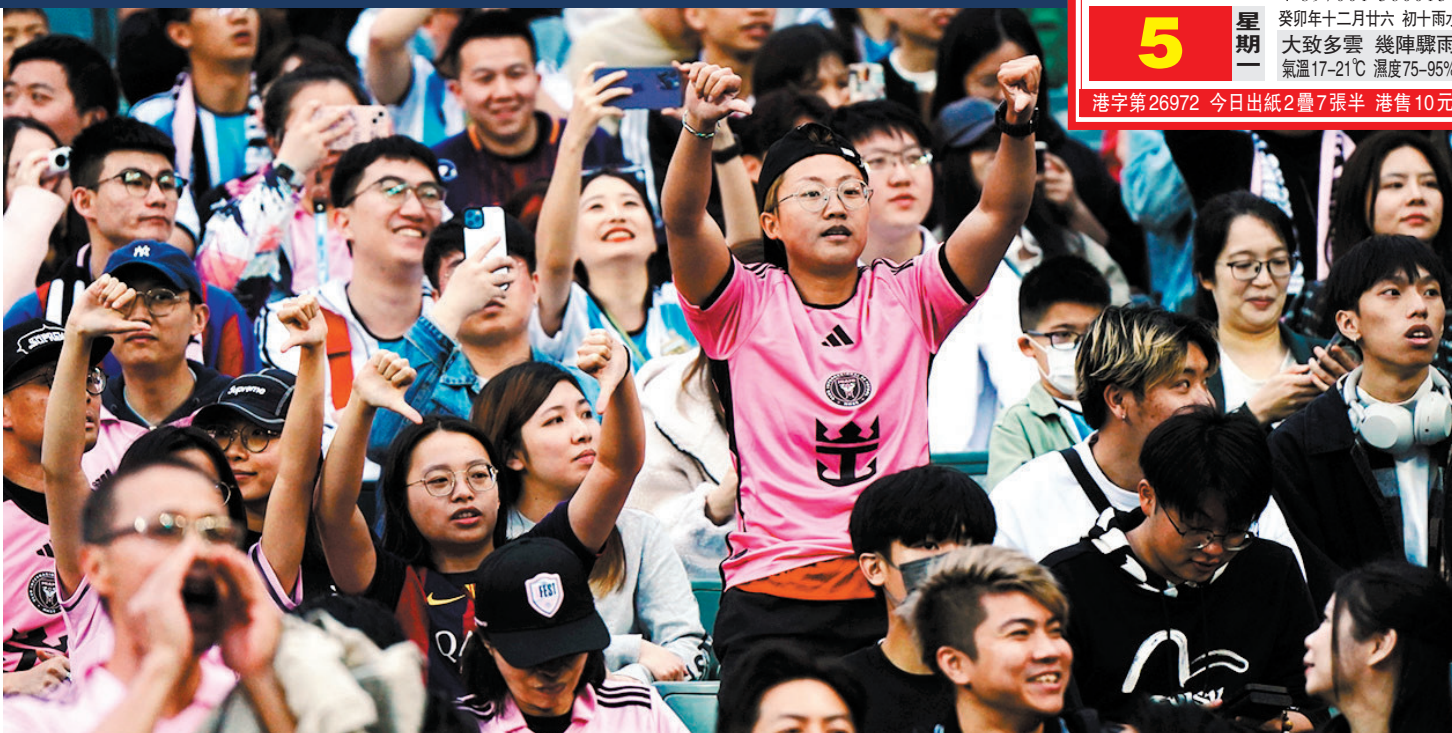
◆球迷對美斯無落場比賽發出噓聲表示極度失望。

萬眾期待的国际邁亞密對香港隊表演賽昨日於香港大球場上演，是次有球王美斯作為號召力的賽事，吸引逾3.8萬名市民與旅客入場觀賽，現場幾近座無虛席，亦足證香港這個盛事之都的魅力。不過，大眾引頸以待的球王美斯和另一名球星蘇亞雷斯，最終卻齊齊未有落場，令萬千球迷極度失望、敗興而回。香港特區政府昨晚發出聲明表示，美斯未能上陣，亦未應要求在場內親自向球迷說明原因，政府和一眾球迷感到極度失望；