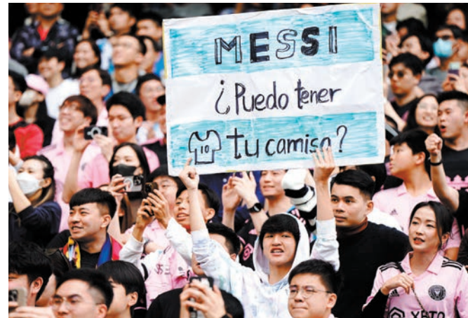
◆球迷熱情最終卻換來失望。