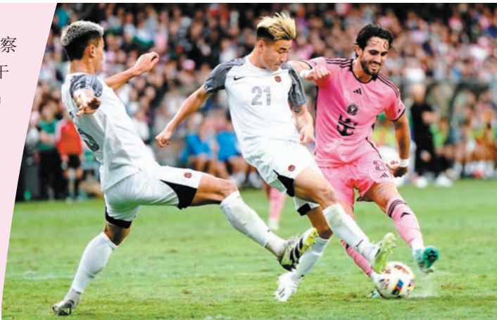
◆球員落力作賽。

聲明說，不少香港球迷熱切期待，更有許多遊客專程來港觀賞，美斯未能上陣表演賽，亦未應要求在場內親自向球迷說明原因，政府和一眾球迷感到極度失望。主辦單位及國際邁亞密CF的處理手法未能回應一眾熱烈支持美斯的球迷的期望，尤其是一眾專程遠道而來的旅客。特區政府文化體育及旅遊局和大型體育活動事務委員會會根據協議條款要求主辦單位負責，包括可能因應美斯未能出場而扣減贊助款項。