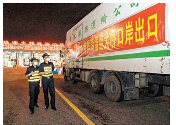
◆經港珠澳大橋運送的鮮活食品種類增加，與文錦渡看齊。圖為雞蛋經港珠澳大橋通關赴港。 資料圖片

至於在工業大廈經營食肆方面，她指出於消防、走火及建築物等考慮，較難拆鬆綁。在衡量市民需要與法規管制上，她認為倘若法規能夠保障市民的安全，則應該堅守，「給顧客一個安全的環境非常重要，經營者必須思考在這樣的處所是否能夠提供一個安全的環境給大家用餐。」