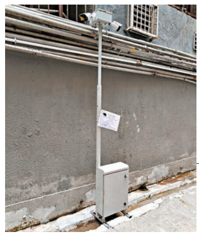
▲熱能探測攝錄機。