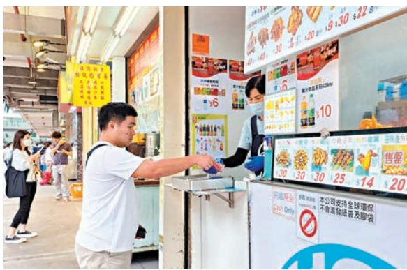
◆食環署大幅放寬對小食食肆售賣食物種類的限制。圖為小食食肆。 資料圖片

優化食物業牌照制度亦是食環署的一項重要工作。食環署署長楊碧筠近日在接受香港文匯報訪問時指出，優化食物業牌照制度的原則是在無損食物安全和環境衛生的同時，盡量便利食肆的經營者和顧客。她表示，去年3月推出的「專業核證制度」作為申請正式牌照的額外選擇，以及大幅放寬對小食食肆售賣食物、種類的限制兩項措施，均受業界廣泛支持。她指出，「專業核證制度」能夠幫助牌照申請人士節省約14個工作天。