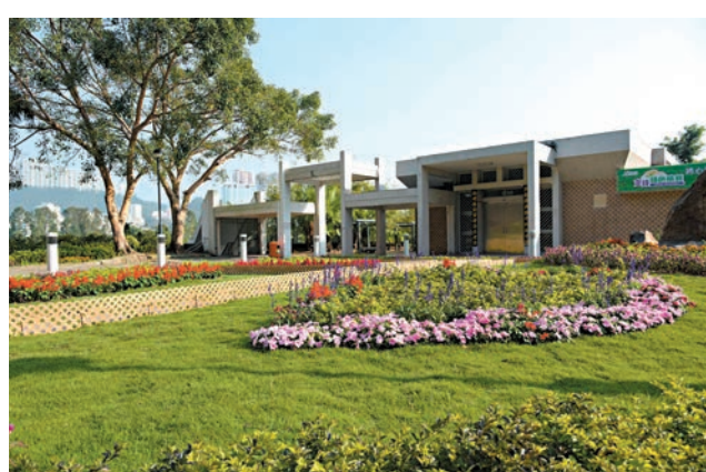
◆食環署在推廣綠色殯葬上頗有成效。圖為提供免費撒灰服務的香港新葵涌紀念花園。

家屬追思先人。她說，為進一步提升殯葬服務，食環署今年還會推出申請火化、綠色殯葬、龕位編排以及繳費的一站式網上服務，「現時許多市民說雖然網上服務有，但不知道怎麼使用，或者覺得網站內容太繁複，不知如何搜尋合適的服務。」她指出，用到殯葬服務的家屬，一般都是沒什麼經驗，加上心情已經很悲傷，「推出一站式服務之後就會讓想使用服務的人更加便利。」