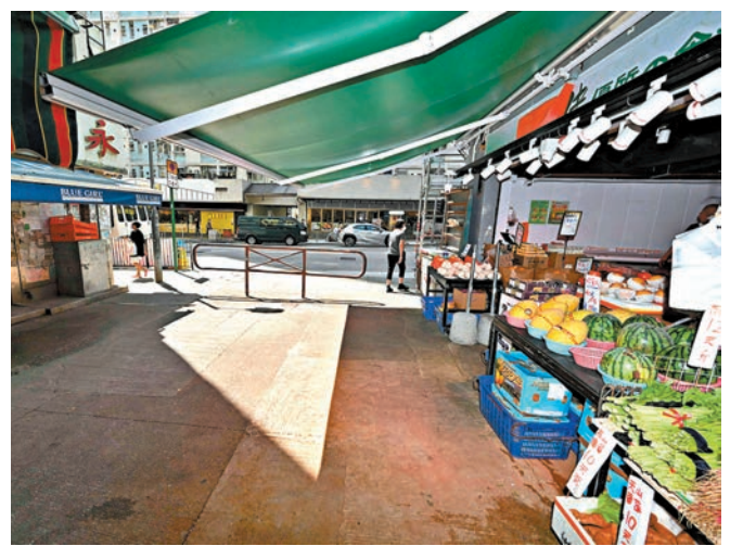
數據顯示，過去一年食環署與警方共進行了逾1,600次聯合執法行動，檢取、充公或清除了逾20公噸貨物，食環署共發出逾7,700張定額罰款通知書。