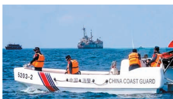
◆ 菲方民船對其非法「坐灘」仁愛礁軍艦運送生活物資，中國海警全程跟監監控。

香港文匯報訊 中國海警局3日通過其官方微博賬號表示，2日，菲方1艘小型民船對其非法「坐灘」仁愛礁軍艦運送生活物資，中國海警全程跟監監控。據《環球時報》報道，南海問題專家表示，通報相關表述顯示中方在仁愛礁及其附近海域擁有絕對的主動權和控制力。菲律賓的挑釁舉動只會破壞中菲關係以及地區和平穩定。 中國海警局3日強調，中國對包括仁愛礁在內的南沙群島及其附近海域擁有無可爭辯的主權，中國海警依法在中國管轄海域持續開展維權執法活動。 中國海警局1月27日曾發布消息稱，1月21日，菲律賓1架小型飛機向非法「坐灘」軍艦空投補給，中國海警實時跟監掌握，依法依規管控處置，對菲方補給必要生活物資作出了臨時性特殊安排。 公開資料顯示，1999年，菲律賓一艘坦克登陸艦以故障為借口在中國仁愛礁非法「坐灘」。此後，菲方雖再三承諾撤走該艦，但至今未履約，反而企圖通過大規模維修加固，實現對仁愛礁的永久佔領。