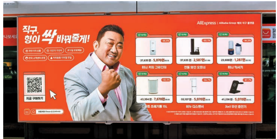
◆ 中國成為韓國最大的跨境電商進口來源國。圖為韓國知名演員馬東錫為AliExpress代言廣告。