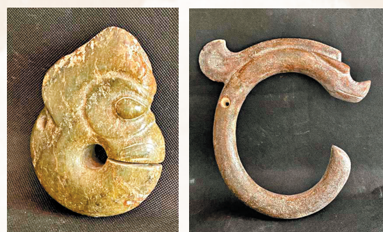
◆紅山玉豬（祖）龍 ◆C字龍