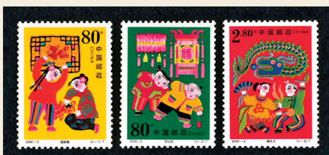
◆《春節》特種郵票一套3枚（2000年）