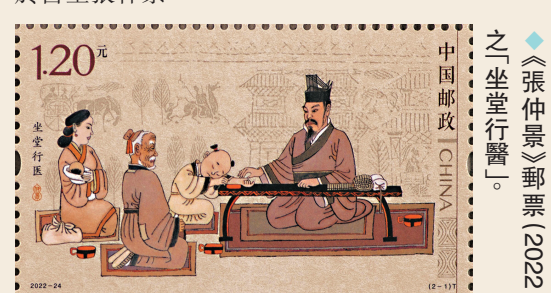
◆《張仲景醫聖之坐堂行醫》郵票(2022) 東漢末年，任長沙太守的張仲景，一邊理政一邊坐堂行醫。當時災害嚴重，特別是每到飢寒交迫的冬季，眾人的耳朵都因凍瘡爛爛，傳說他

值得一提的是，餃子作為我國歷史悠久的一種民間美食，素有「好吃不過餃子」的讚譽。春節期間餃子是不可或缺的佳餚，但這個習俗據說源於醫聖張仲景。