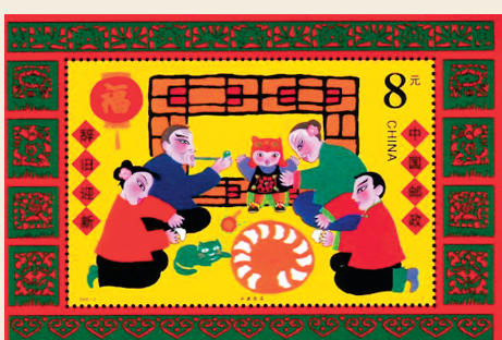
◆《春節》特種郵票小型張（2000年）