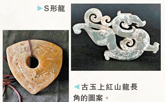
▶S形龍 ◆古玉上紅山龍長角的圖案。

三星他拉龍的「體捲曲，呈C字形」的形體造型以及「雙眼突起呈梭形」的縱目特徵，在隨後的兩三千年間，在凌家灘「玉龍」上，在良渚遺址的反山玉鐲上，在龍潭港寬把陶杯的龍形紋飾上，在亭林遺址的蛇紋陶片上，在羅家柏嶺的玉雕龍形環上，在肖家屋脊的玉雕盤龍上，在石家河文化的透雕龍形佩上，在孫家崗的玉雕龍形佩上，在陶寺的彩繪龍陶盤上，在二里頭遺址的龍紋陶片和綠松石龍形器上，都是在或具象或抽象地出現着。