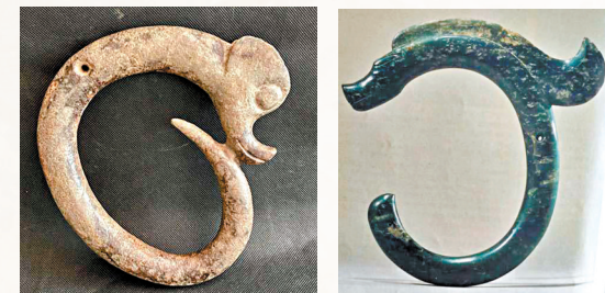
◆「玉祖（豬）龍」與「C字龍」在中間環節演變佐證實物之一。 ◆中國國家博物館展出的翁牛特旗三星他拉玉龍。

為了放大「玦」作為「祖先崇拜」載體的功能，「玉玦」被藝術為「玉祖（豬）龍」。為什麼將至今通稱的「玉豬龍」改為「玉祖龍」呢？筆者以為，所謂紅山玉豬龍，不是紅山先民對豬的崇拜，是紅山先民對自己祖先崇拜的「變態藝術形象」。是祖先化天帝崇拜的物化。玉器上的造型不是「豬頭」，是人類胚胎早期的幼兒體態。這從現今的人類嬰兒發育標本中顯而易見。