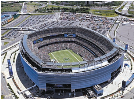
◆2026年世盃的決賽場地。美聯社