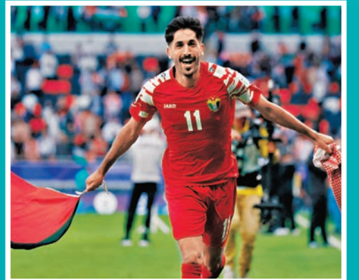
◆艾賴密在分組賽曾經攻破過韓國隊大門。資料圖片