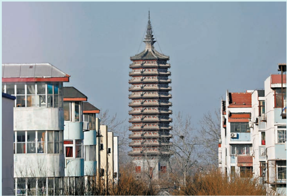
◆有分析認為，此次北京通州區優化限購政策進一步強化市場修復預期。 資料圖片

北京市住建委和通州區政府聯合發布，自2月6日起調整優化通州區商品住房銷售政策，具有北京市購房資格的四類家庭可在通州區購買1套商品住房：一是京籍無房家庭；二是在京已擁有1套住房的通州戶籍家庭；三是在京已擁有1套住房，與在通州區註冊或經營的企業、疏解搬遷至通州區的黨政機關、企事業單位存在勞動關係的北京戶籍家庭；四是在京未擁有住房，與在通州區註冊或經營的企業、疏解搬遷至通州區的企事業單位存在勞動關係的非京籍居民家庭。這意味著，今後在通州區落戶或就業的家庭，如需購買通州區商品住房，符合北京市的整體限購政策即可，不再受到「雙限」的制約。