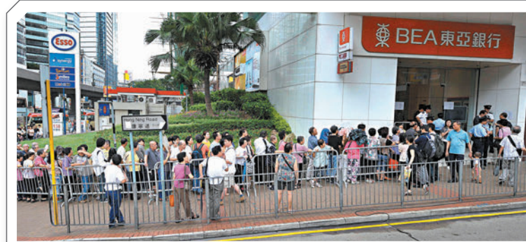
◆過往香港曾發生過不少銀行擠提事件。資料圖片

虛擬銀行ZA Bank昨亦表示歡迎存保會相關建議，相信相關決定已充分考慮各界意見。發言人指，樂見全港銀行用戶將有更大保障，有助加強公眾對銀行業界包括數碼銀行的信心。又指作為數碼銀行的領跑者，ZA Bank致力提供安全可靠、有溫度的金融產品和服務。最新推出的活期存款產品「錢罌」，亦是符合香港存款保障計劃保障資格的存款。