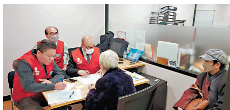
◆政府部門的表格往往詳盡得令人生畏。圖為關愛隊隊員協助年長居民填寫表格。

她後來在另外一個部門做另外一些要申請錢的項目時，就會交代同事，「市民要填表不可以填多過兩版。」她說，大家用這個思維，其實可以達到很好的工作結果，倘若沒有這個思維，可能表格會設計很多內容填寫，也會因此衍生很多需要解釋的複雜內容。「做了這麼多年，我經常都記住，每逢做一個政策措施，每一個階段都要想一下，『你的受眾，在他的角度，他想要什麼，他不要什麼，我們可不可以做到呢？』」