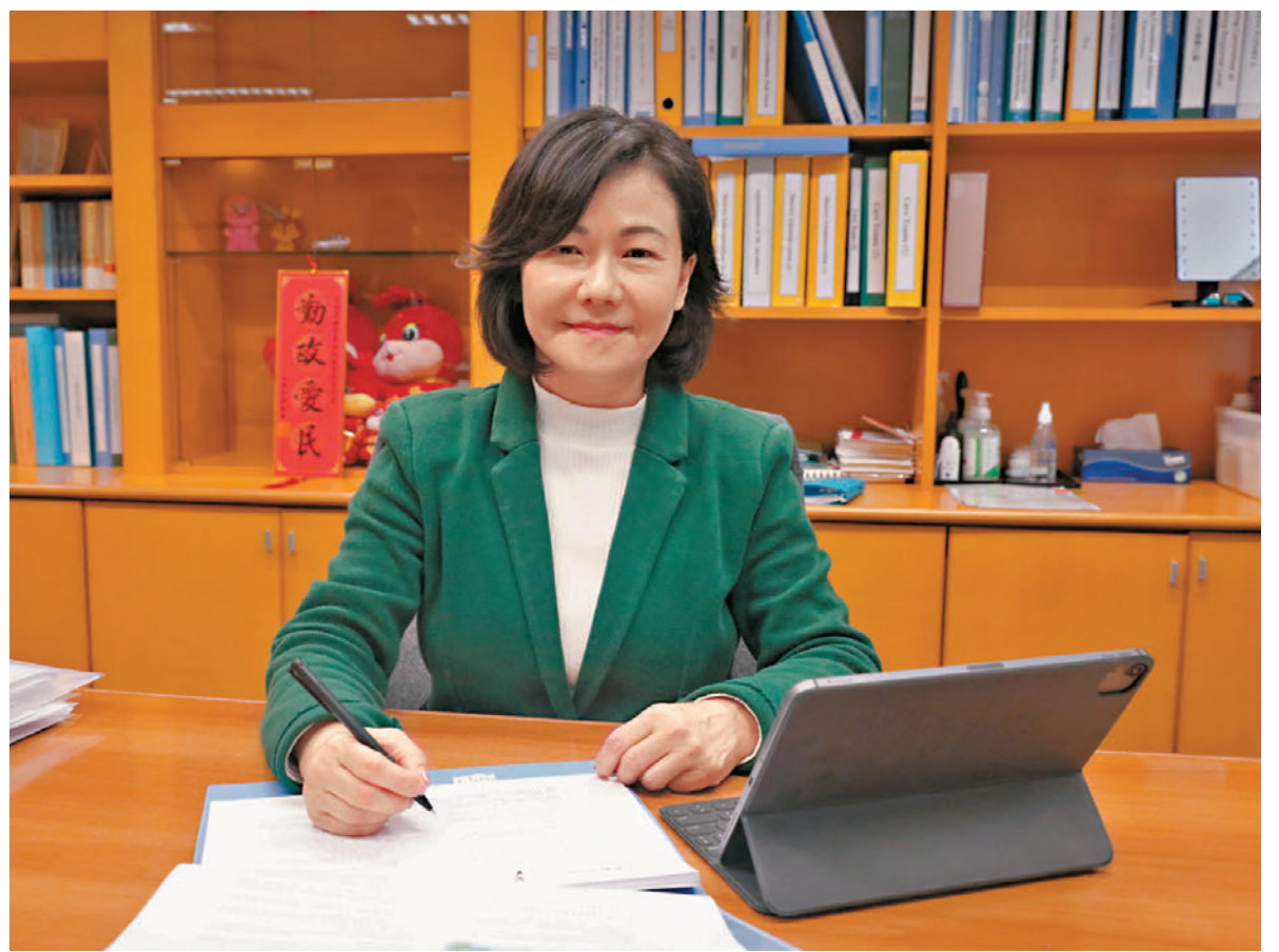
◆民政事務總署署長張趙凱渝日前接受香港文匯報獨家專訪時希望，新一年能做到「實」，要扎實用好新制度、為民做實事。

新的一年，張趙凱渝希望總署的工作在「創」的基礎上做到「實」，包括用好區議會這個「創」出來的新制度，關愛隊亦要陸續做更多探訪和活動，包括在日常家訪中，協助識別獨老、雙老及照顧者轉介給有關單位等，為市民提供愈來愈多的貼心服務。