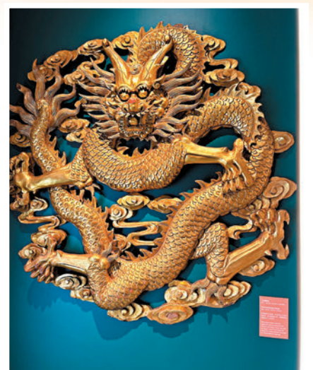
◆正面龍牌是特別為酒樓而製作的。