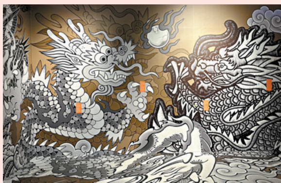
◆大型壁畫當中藏着多個貓眼細孔。