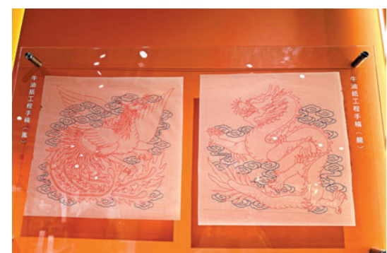
◆福興火鍋龍鳳招牌手稿。

除此之外，當年不少以龍為主題的場景，都出自本土師傅的設計與製作，例如海洋公園的集古村天花裝飾及甜品店許留山的招牌等等。