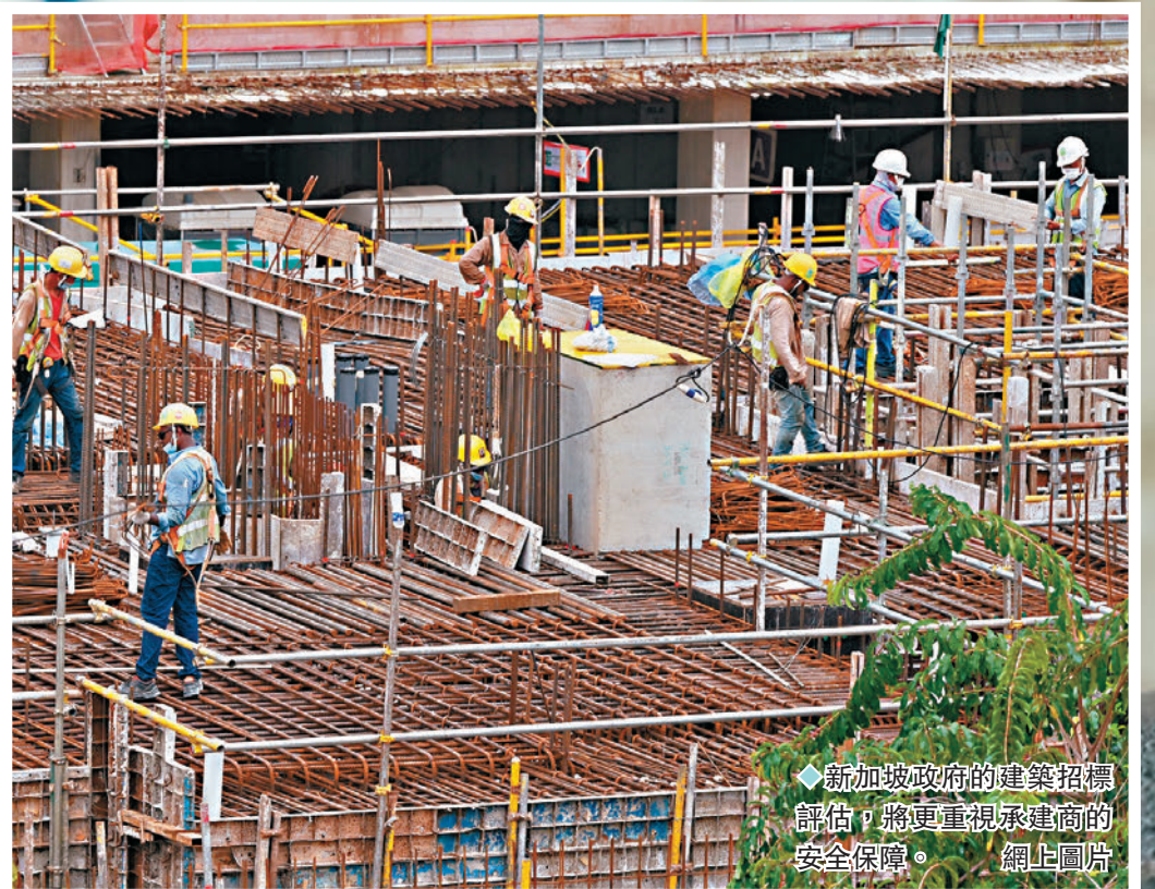
◆新加坡政府的建築招標評估，將更重視承建商的安全保障。

香港文匯報訊 香港工作場所安全事故頻發，建築業安全尤其需要重視。全球多地近年都加強建築業安全監管，新加坡建設局和人力部上周五（2月2日）宣布從今年4月起，政府的建築招標評估會更重視承建商的安全保障。新規會擴大暫時禁止參與招標規定覆蓋範圍，安全紀錄欠佳的企業會被禁止參與公共部門建設工程招標3個月至兩年不等。如果承建商能加強地盤施工安全保障，便可獲得更有利的評估、提升中標機會。