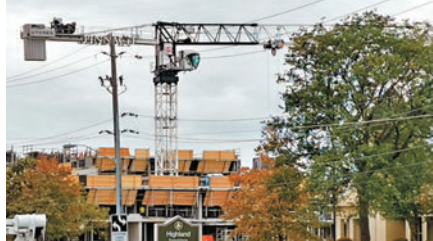
◆加國建築業蓬勃發展，政府竭力降低工地的建築安全風險。