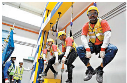
◆承建商須加強工人培訓。

新加坡建設局和人力部表示，新措施希望鼓勵承建商遵守合約的安全規範，主動提升施工安全標準，利用先進技術和適當安排資源，提供更具創意、行之有效的施工安全方案。當局期待更多承建商形成施工安全文化，盡力保障工人的安全和健康。