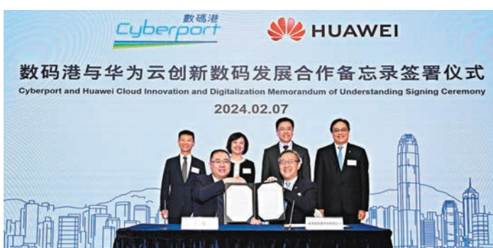
◆ 數碼港與華為雲簽署合作備忘錄。

香港文匯報訊(記者 曾業俊)華為雲與數碼港昨日簽署合作備忘錄，為推動產業雲創新和促進科技產業鏈發展協作定下框架。是次合作為期三年，涵蓋人工智能(AI)與Web3等領域，包括共同開拓「Web3產業雲端」平台及技術鏈，加快Web3技術應用，為本地初創提供基礎設施，並促進傳統企業