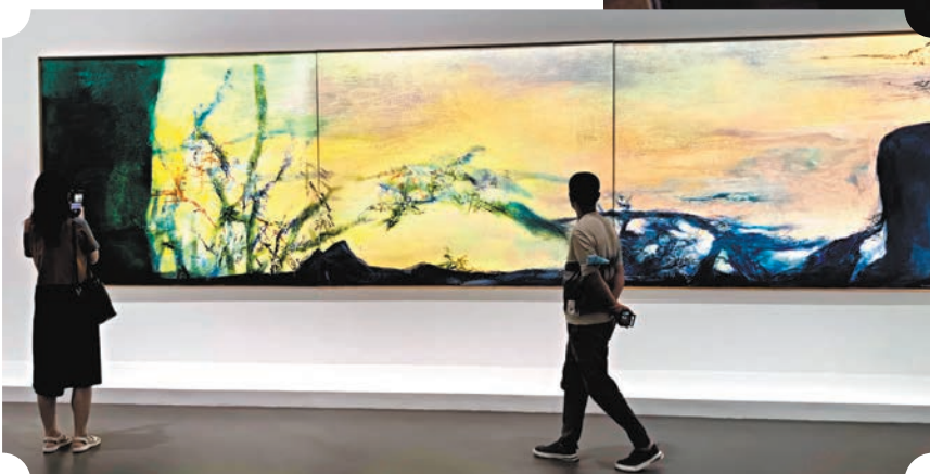
▲「大道無極——趙無極百年回顧特展」吸引了來自世界各地約20萬名觀眾。