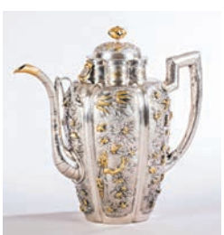
◆凡爾賽宮館藏的「花鳥紋雕銀部分鍍金水壺」。

作為「凡爾賽宮與紫禁城：17、18世紀的中法交往」的配套活動，凡爾賽宮皇家歌劇院管弦樂團將於4月首次赴華，在多個城市演出。