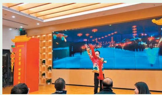
◆年會演唱：《咱們屯裏的人》

「屯子磊（裏）面發生過，黑多黑多（很多很多）的事，回想系（起）那是特別的眼，朋友們若系（是）有森確（興