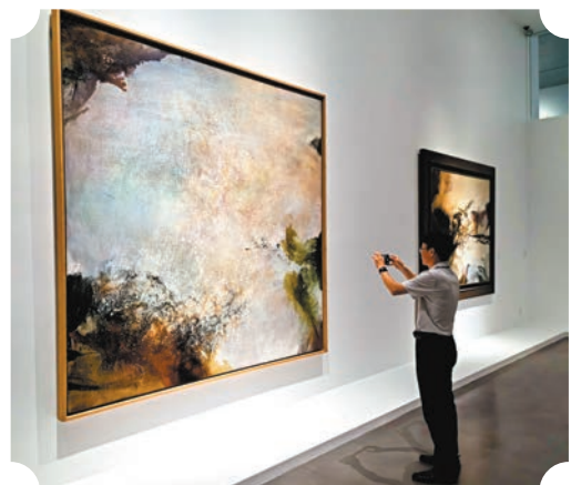
▲中國美術學院的「大道無極——趙無極百年回顧特展」成為網紅藝術展打卡地。

2024年1月27日，是中法建交60周年紀念日。以享譽世界的法籍華裔畫家趙無極為主題的「大道無極——趙無極百年回顧特展」第三次學術研討會：「兩個傳統、兩個世紀——世界藝術史中的趙無極」27日至28日在中國美術學院舉辦。研討會邀請中國、法國等國內外專家學者，從藝術史、藝術世界、文化交流、文明互鑒等不同視角，共同探討趙無極的藝術在世界藝術史中的獨特意義，呈現趙無極在東西文明互鑒、中法文化交流中的獨特影響。