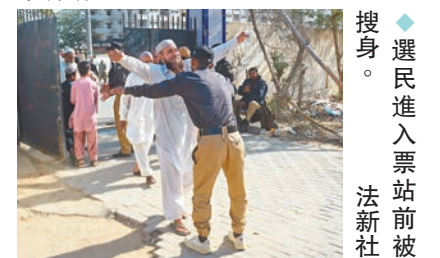
選民進入票站前被殺身。

兩個候選人競選辦公室外，周三接連發生炸彈襲擊，造成30人死亡及約50人受傷，激進組織「伊斯蘭國」(ISIS)宣稱這兩宗爆炸是他們所為，當地警方已展開調查和搜索行動。