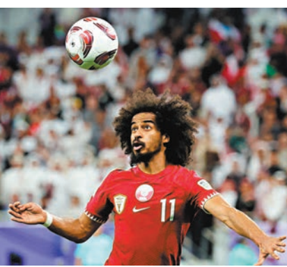
◆卡塔爾頭號前鋒阿菲夫剛戰攻入一球。