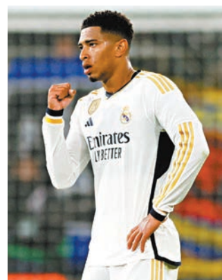
◆皇馬中場比寧成過去兩月的入球率不及季初搶鏡。

在第3位落後皇馬8分的巴塞隆拿，上仗3：1戰勝艾拉維斯於西甲止頹連贏兩場，此戰期望趁勢在本輪主場對倒數第二位的CF格蘭納達一戰再下一城。(now632台周一4：00a.m.直播)