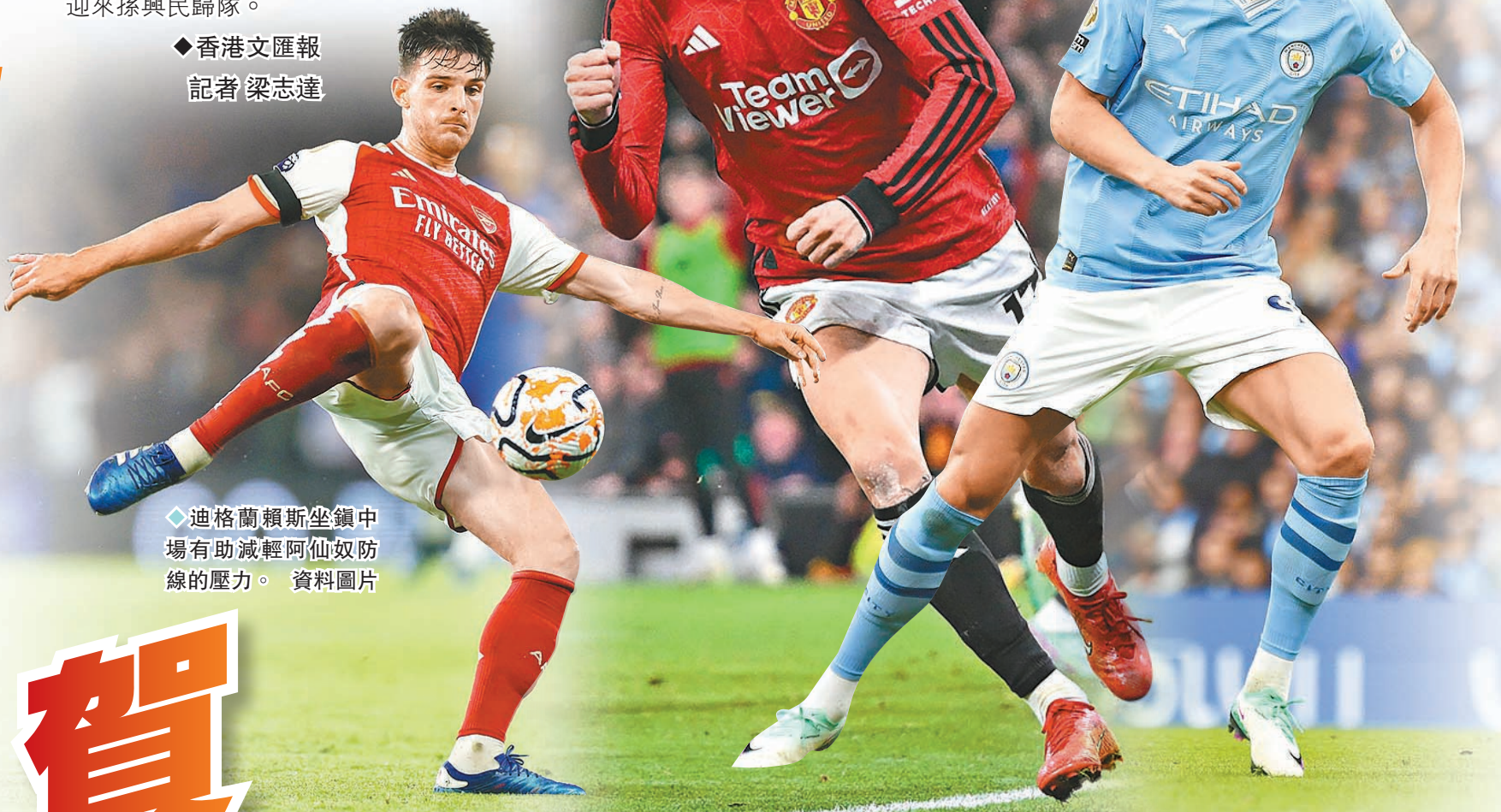
◆曼聯翼鋒加拿祖上仗梅開三度。資料圖片