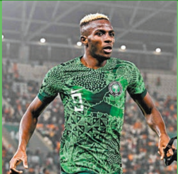
◆奧森漢在尼日利亞鋒線掛帥。

尼日利亞鋒線有拿坡里球星奧森漢壓陣，整體表現亦較科特迪瓦四平八穩，本屆賽事取下5勝1和成績，包括分組賽1：0擊敗過今場對手科特迪瓦。唯一不利「超霸鷹」的是，他們剛戰與南非隊賽和1：1後踢加時兼互射12碼，最終苦戰才成功過