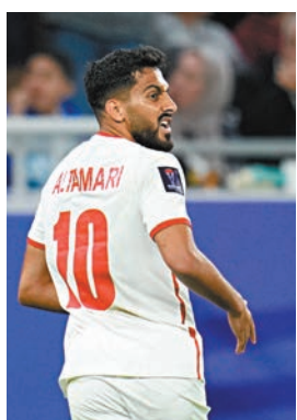
◆達馬里帶領約旦隊衝擊冠軍。資料圖片

卡塔爾隊則在昨日凌晨結束的準決賽，憑頭號前鋒阿菲夫一傳一射建功反勝伊朗隊3：2，6戰6勝。亞洲盃前一個月才接手卡塔爾隊的主帥馬基斯說：「今晚我的球員表現得不遺餘力，我們距離衛冕僅有一步之遙。」