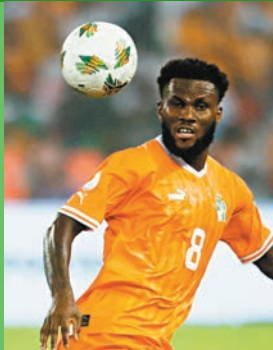
◆基斯爾在科特迪瓦隊中場鋪橋搭路。

關，球員體力上未必能及時完全恢復，這或會成爲左右他們能否一掃11年之癢奪冠的重要因素。