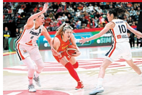
◆中國隊球員李夢(中)在比賽中突破。