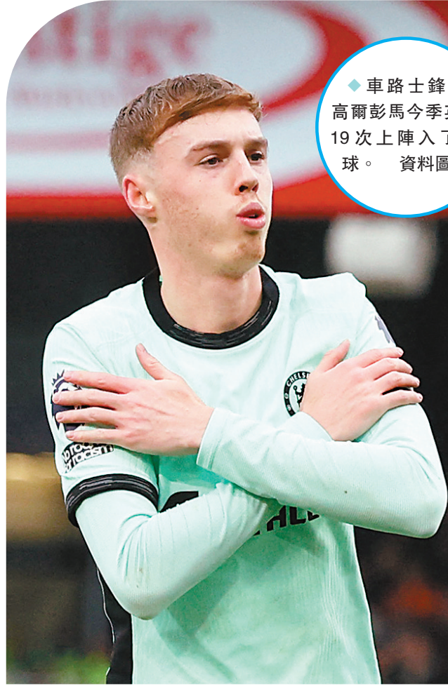
◆車路士鋒將高爾彭馬今季英超19次上陣入了10球。資料圖片