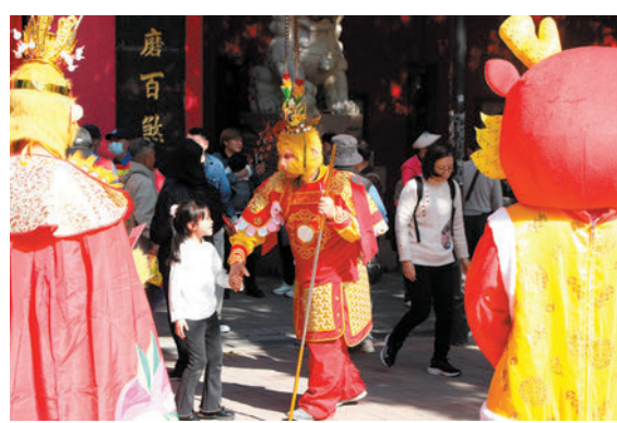
◆有旅客以美猴王裝扮現身，吸引不少善信「打卡」。