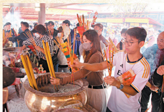
◆大批善信在車公廟上香。