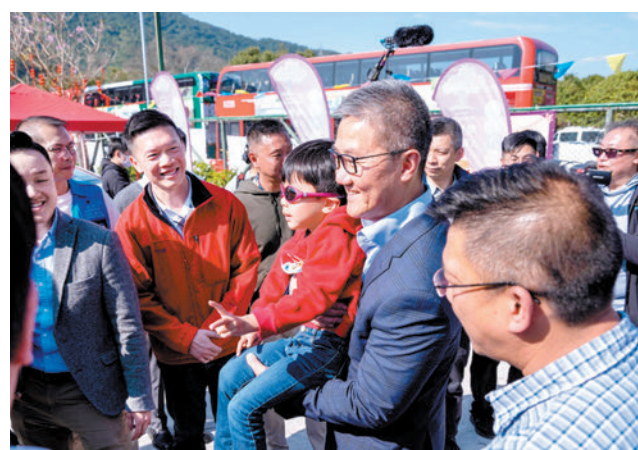
◆警務處處長蕭澤頤在大埔林村抱起一名小市民一同合影。

被問到警方在農曆新年期間發出了多少張違例泊車告票。蕭澤頤表示暫未有統計，重申警方是希望藉此減低嚴重傷亡意外，在盡量可行情況下，會行使酌情權，但不希望有不負責任的泊車行為，令行人要行出馬路，從而發生一些危險情況。