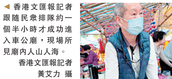
◆香港文匯報記者跟隨民眾排隊約一個半小時才成功進入車公廟，現場所見廟內人山人海。