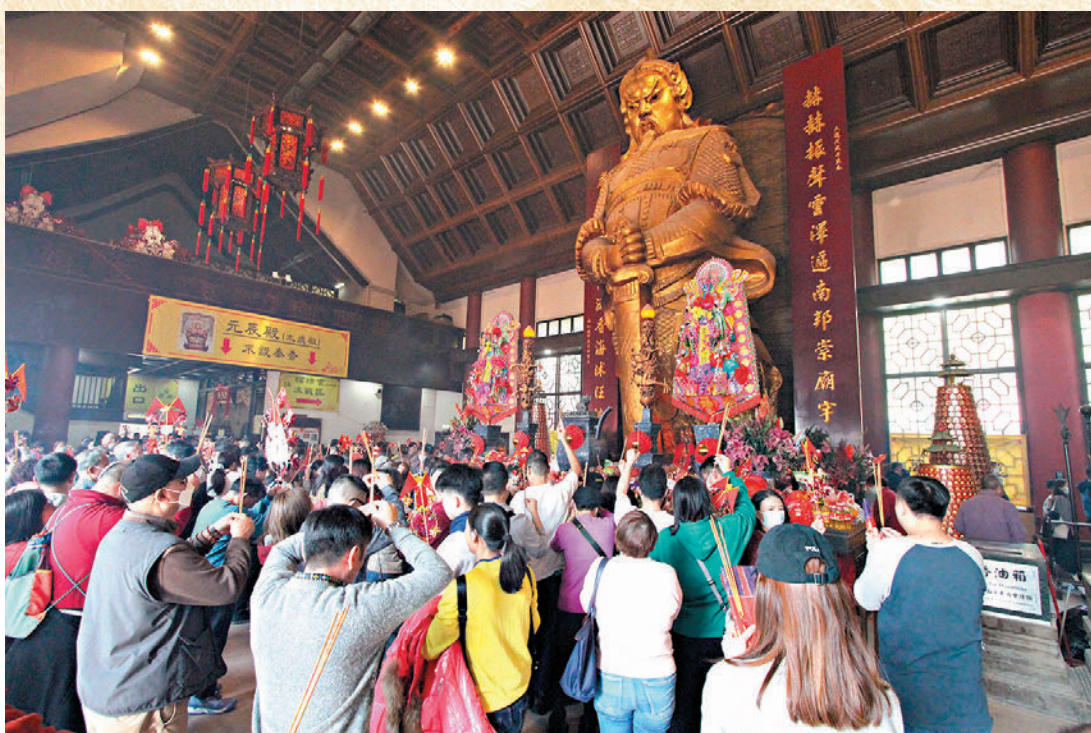
◆大批香港市民和訪港遊客在龍年大年初三當天，前往沙田車公廟按中國傳統習俗上香祈福。

錢先生同樣擺檔多年，今年其攤位設置在市集的最後位置。他表示，感覺今年的人流比上年少約三分之一，「人流足夠，但是大部分人出廟後，都不會行入市集。」錢先生亦指出今年的貨品批發價約一兩成，而攤位出售的自家廠製的經典風車製作成本亦增一成，形容樣樣都貴了，但生意額一般，下年競投攤檔前要认真考慮清楚。