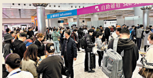
◆截至昨晚9時，有超過51.7萬人次經各口岸和機場離港，圖為香港西九龍高鐵站。

另外，前晚初二的賀歲煙花吸引大量內地客來港，深圳灣口岸及羅湖口岸分別通宵及延長服務至凌晨2時，以疏導旅客。入境處資料顯示，羅湖口岸初二有112,939人次出境，包括3.7萬名內地旅客，深圳灣口岸則有近6.6萬名