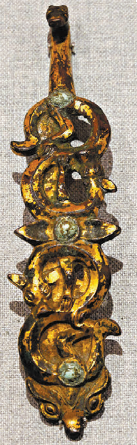
◆戰國銅鑲金嵌石龍紋帶鈎

什麼是龍？在考古發現中，距今約八千至四千年的新石器時代晚期，遼河、黃河、長江流域可見一種獸首、長驅的動物造型。儘管如今的龍紋盡人共識，但最早的時候，龍紋並不像今天的龍紋這樣易於辨識。展覽中，我們可以見到商周龍紋，跟隨圖樣辨認其目、足、爪、尾，它的形象應由多種動物組合而成，鱷魚和蛇的特徵在其中最為突出。從商代的甲骨卜辭開始，文獻記載中的龍就多與水有關聯。它被認為是招雨的瑞獸，在先民的祭祀中佔有重要地位。