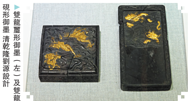
◆雙龍鑿形御墨（左）及雙龍硯形御墨 清乾隆劉源設計