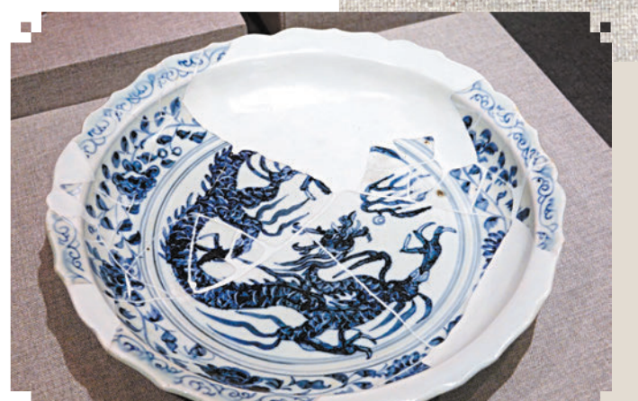
▲青花龍戲珠紋盤 元 印度尼西亞東爪哇特魯烏蘭出土