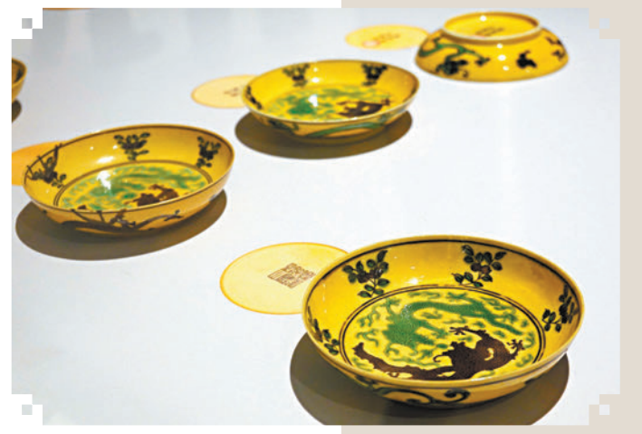
▲黃地素三彩雙龍紋碟一組 清康熙至光緒