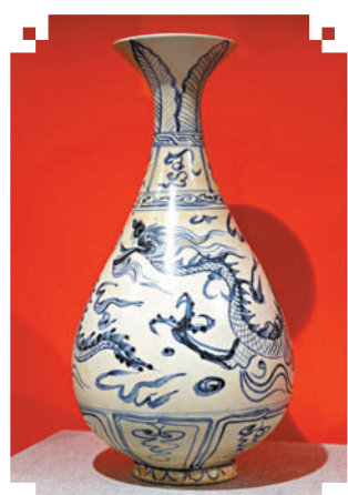
▲青花龍戲珠紋玉壺春瓶 後黎朝前期（越南十五世紀）

另一重點展品為中大文物館最近才集齊的藏品，為康熙年一直燒製到宣統年的同款瓷器，一組八款不同年份的黃地素三彩雙龍紋碟，盤內底雙龍欄內繪有雙龍戲珠紋，紫、綠兩條龍一升一降相對舞動。展覽的最後一件展品為香港畫家葉因泉先生未完成的《百子迎春圖軸》，畫的是春節街上的舞火龍民間風俗場景，配以彭智文《尋龍》一文中的段落，餘韻悠長。