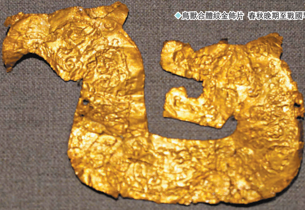
◆鳥獸合體紋金飾片 春秋晚期至戰國早期

龍這一帶有神秘色彩的生物，在古代中國文化中擁有舉足輕重的地位。提及龍紋，也許會先想到帝王袍服、皇權威嚴，但其背後的文化內涵卻遠不止於此。龍年伊始，香港中文大學（中大）文物館循例舉辦「甲辰說龍」特別展覽，以中國古代文物中的龍紋為線索，用50多件館藏珍寶，探討其來「龍」去脈，包括紋飾的形成及風格的變遷。展覽將持續至7月31日。