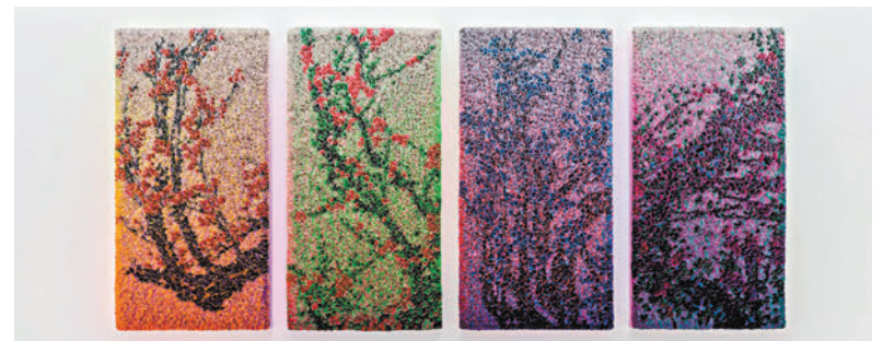
◆「春花弄影」象徵着春天的重生。