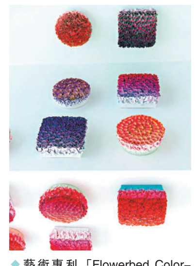
◆藝術專利「Flowerbed Color-change」是莊紅藝作品的亮點。