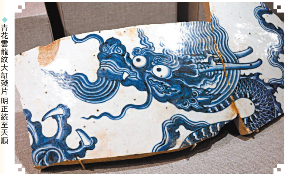
◆青花雲龍紋大缸殘片 明正統至天順