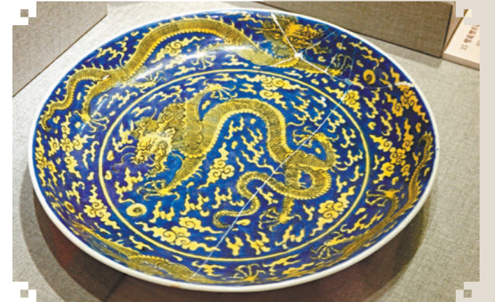
▲藍地黃龍戲珠紋盤 清康熙