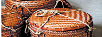
存錢考下你：一個籬一個籬，如個有十個籬得九個蓋，點啱呀？阿爺，你咪答咗囉！有咩？你講咗最後三個字——「點啱呀」！話時話，舊年年尾國泰粵劇團，搞到咁嘅咁係係遲遲就取消，都可以講得係「十個籬九個蓋」喇！取消一兩班就係咁講，日日取消十幾班就係講「十個籬七個蓋」喇！