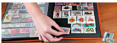
存錢，「草」郵票只係一個啱字，話唔埋可以升值嘅！