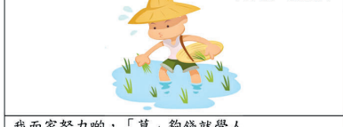
我而家努力啲，「草」夠錢就學人... 如果你話「草老婆」，咁你就努力啲！