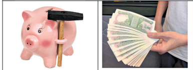
媽咪，買豬仔錢筒送錢仔，個錢仔有咩用？你「草」到滿，就個錢仔掛個，再晒的錢筒嘅嘍！雖然係十幾紙，但係係舊版，咁大疊，「草」咗好幾十年喇！