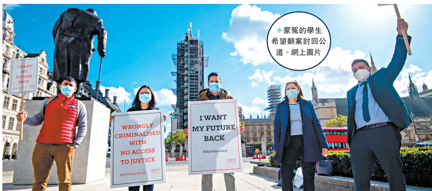
蒙冤的學生希望翻案討回公道。

在過去10年間，多項調查均對內政部的決定提出質疑，認為內政部「倉促懲罰」學生，對大量國際學生造成不公正。在野黨議員蒂姆斯協助倫敦東部東漢姆選區的許多國際學生，挑戰內政部的指控，「大量學生被錯誤指控作弊，失去簽證和儲蓄，有些人放棄了學位，他們的生活被毀。10年過去了，有些人因作弊指控感到羞恥而無法回家，他們的家人相信英國政府的指控一定是真的。」