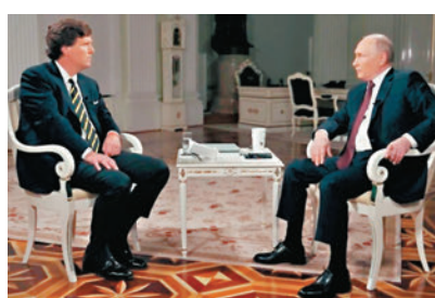
◆普京(右)接受卡爾森採訪，揭穿美國謊言。

俄羅斯衛星通訊社報道稱，普京受訪時解釋說，莫斯科不會攻擊北約國家，俄羅斯也不打算攻擊波蘭、拉脫維亞或其他波羅的海國家。西方政客們經常用俄羅斯威脅論「嚇唬」他們的人民，轉移人們對其國內問題的注意力。