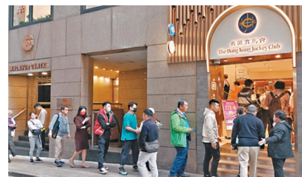
◆中環士丹利街投注站昨日人頭湧湧。