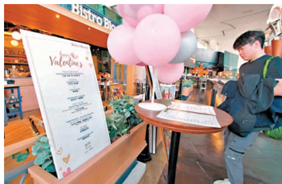
◆不少餐廳推出情人節特別套餐。

另一間位於商場頂部的餐廳負責人就感嘆今年情人節生意慘淡，「現在只訂到三成滿，本身餐廳的位置已經不是那麼好，加上太多港人北上消費，所以更加沒生意。」她說：「今年情人節晚餐價位與往年差不多，都是400元至600元，但今年成本卻上漲了，不過沒有辦法，再怎麼壓低價格都不及深圳低。」