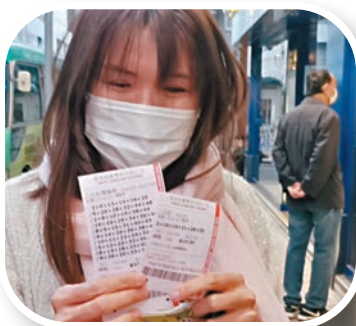
▲張女士去拜年前順道買六合彩。