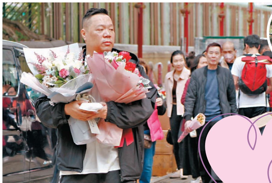
▲玫瑰花是情人節首選。