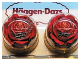
▲玫瑰花形狀的冰淇淋。