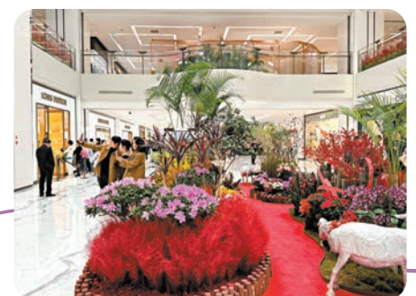
▲北京SKP商場布置喜氣洋洋。

主打創意私房菜的ITB趣餐廳是為數不多推出情人節活動的商家，以「財神愛你」為主題推出了699元情人節套餐，該套餐除了餐食外還包括玫瑰花瓣擺台、燭台和一束玫瑰花。該餐廳2月13日才恢復營業，目前2月14日晚餐的套餐座位已預訂一空。