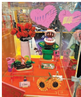
▲玫瑰花和愛情鳥積木。