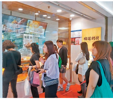
◆港人張女士(左三)在羅湖鮑師傅店用微信支付購買糕點。

根據深圳人行統計，2023年港人到深非現金支付交易3,552.46萬筆、金額85.78億元人民幣，同比分別增長222.5%和70.5%，這組數據顯示港人在內地消費使用跨境電子支付的迅猛增長勢頭。