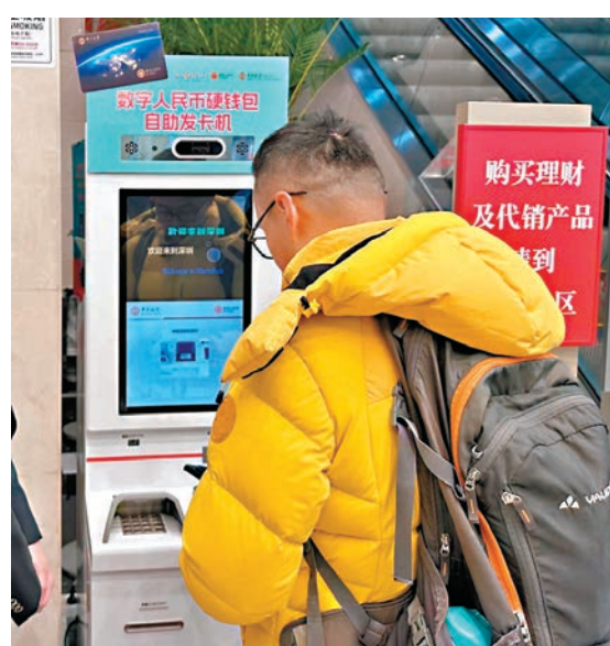
◆港人在深圳中行辦理數字人民幣硬錢包。

談到硬錢包自助發卡機跨境場景後續規劃時，深圳中行有關人士表示，「跨境+硬錢包」在今年迎來2.0升級模式，計劃面向所有境外來華人士，當他們入境後，無需手機網絡，只要憑護照在機場、口岸的中國銀行硬錢包發卡機上領取數幣硬錢包卡（用Visa、Master充值）；即可在機場各商戶消費，再直接坐觀光大巴進入市區。