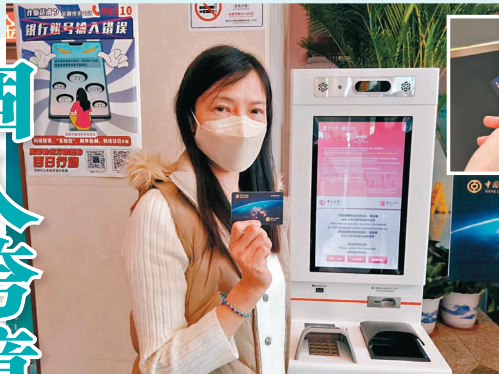
◆港人謝女士去年9月在深圳中行辦理數字人民幣硬錢包，用於購物和消費，感覺很方便。