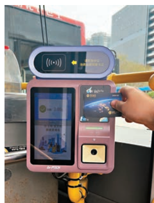
◆數字人民幣硬錢包用於公交支付十分便捷。

數字人民幣還具有「支付即結算」的特性，以及具有防偽、防篡改等安全性能，能夠有效解決許多問題。同時，在使用數字人民幣交費後，資金關係僅在轉賬雙方之間產生，不產生手續費，大大提高了資金到賬效率和安全性。