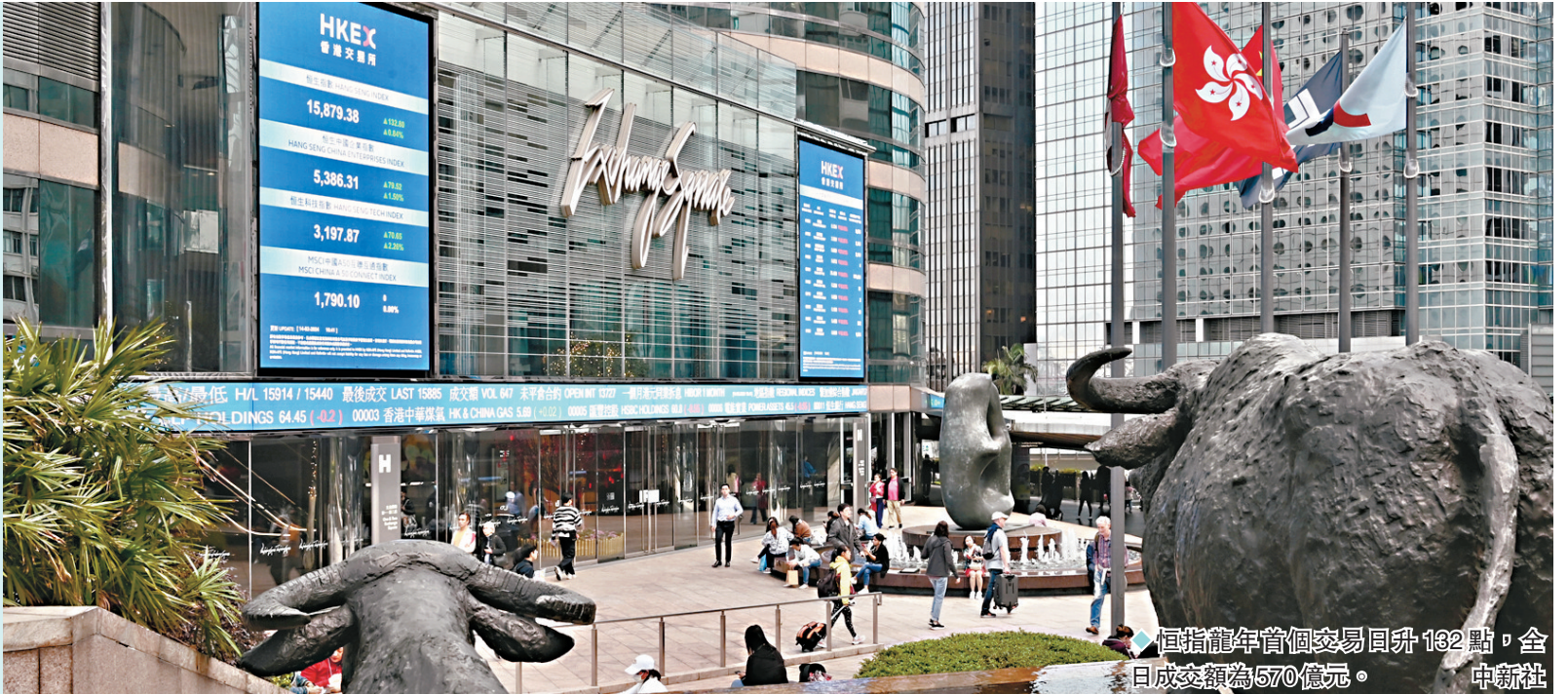
恒指龍年首個交易日升132點，全日成交額為570億元。

龍年首個交易日，恒生指數昨小幅低開，隨後震盪上揚，最終強勢收漲，收市報15,879.38點，漲132.8點，漲幅0.84%；恒生科技指數漲70.65點，漲幅2.26%，收市報3,197.87點；國企指數漲79.52點，漲幅1.5%，收市報5,386.31點。大市全日成交額570.64億元。