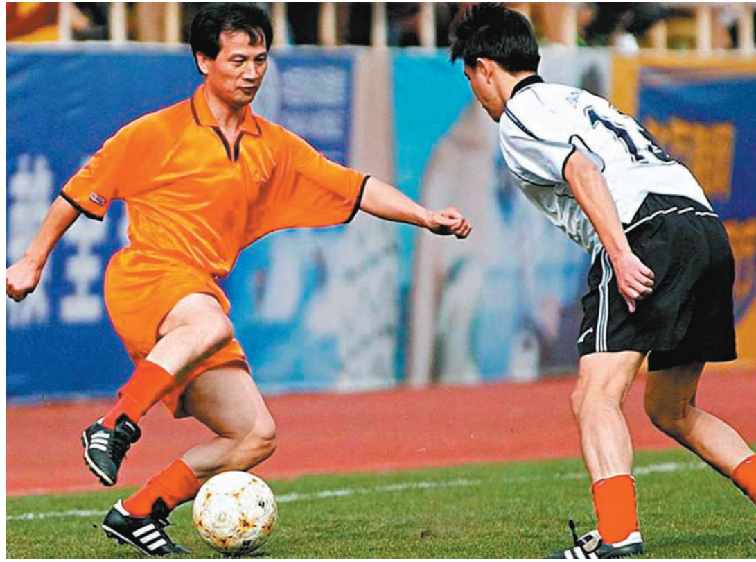
◆古廣明(左)退役後偶爾仍會在比賽中獻技。