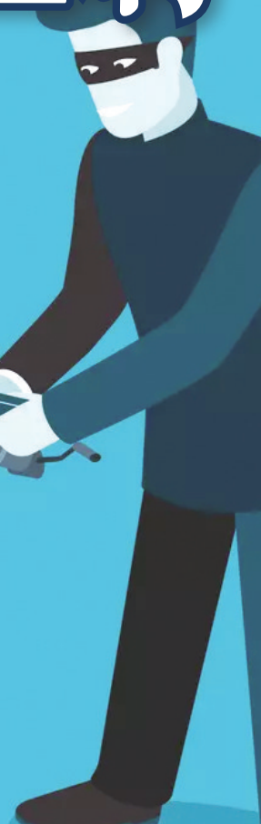
◆類似Fb騙案的「通知」信息。