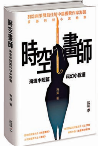
▲《時空畫師：海漣中短篇科幻小說選》。