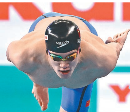
▲潘展樂在男子100米自由泳稱王。